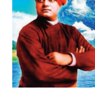
प्रदान करती है। स्वामी जी ने धर्म और विज्ञान के समन्वय पर जो जोर दिया था वह आज के वैज्ञानिक युग के लिए एक दिशा निर्देश है। उन्होंने कभी भी अंधविश्वास का समर्थन नहीं किया बल्कि विवेक और तर्क के आधार पर सत्य को चुनने की बात कही। उनका

स्वामी विवेकानंद का व्यक्तित्व केवल एक संत का नहीं बल्कि एक ऐसे युगदूषक का था जिन्होंने सदियों आगे की चुनौतियों को भांप लिया था। आज के दौर में जब हम तकनीकी चकाचौंध और भौतिक दौड़धूप में अपना मानसिक संतुलन खो रहे हैं तब स्वामी जी की वाणी किसी मरहम की तरह है। उनकी शिक्षाओं में जो सबसे बड़ा मंत्र है वह है आत्मशक्ति का जागरण। वे कहते थे कि मनुष्य को अपने भीतर छिपे असौख सामर्थ्य को पहचानना चाहिए। आज का युवा जब अवसाद और असफलता के डर से घिरा होता है शक्ति केंद्र संयोग्यक सम्मेलन के जरिए पहले ही यह संकेत दे चुका है कि पार्टी विकास और हिंदुत्व के अपने मूल एजेंडे से पीछे नहीं हटेगी।