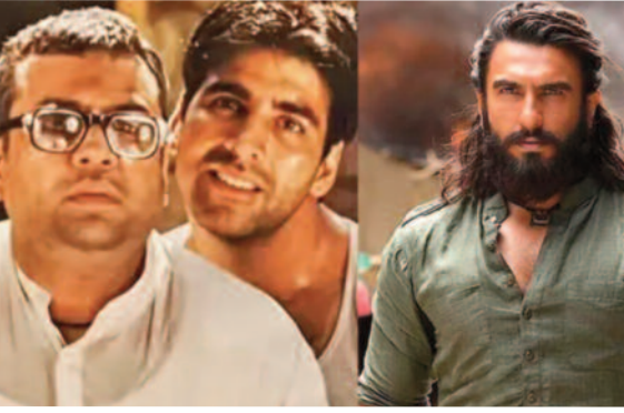
बड़ी फैंचाइजी में से एक बना सकता हूँ। अगर मैंने इसे डायरेक्ट किया होता, तो मैं इसे धुरंधर से भी बड़ा बना सकता था। अक्षय

अक्षय कुमार की हेरी-फेरी 3 से एगिजट लेने के बाद प्रियदर्शन ने अब कहा कि वे इसे धुरंधर से बड़ी फैंचाइजी बनाने वाले थे। प्रियदर्शन ने हेरा फेरी 3 से जुड़ी पदों के पीछे की उथल-पुथल के बारे में खुलकर बात की है और उनके बयानों से इस पसंदीदा फैंचाइजी के लिए हालात काफी निराशाजनक लग रहे हैं। एक खास बातचीत में, फिल्ममेकर ने क्रिएटिव मतभेदों और चल रहे विवादों, दोनों पर खुलकर अपनी बात रखी।