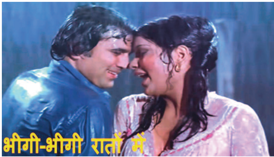
भीगी-भीगी रातों में

हम बात कर रहे हैं साल 1974 में आई फिल्म अजन्बी के गाने भीगी भीगी रातों में के बारे में। इसे लीजेंडी सिंगर किशोर कुमार और लता मंगेशकर ने गाया था। इस खूबसूरत गाने का संगीत आर. डी. बर्मन ने दिया जबकि इसके