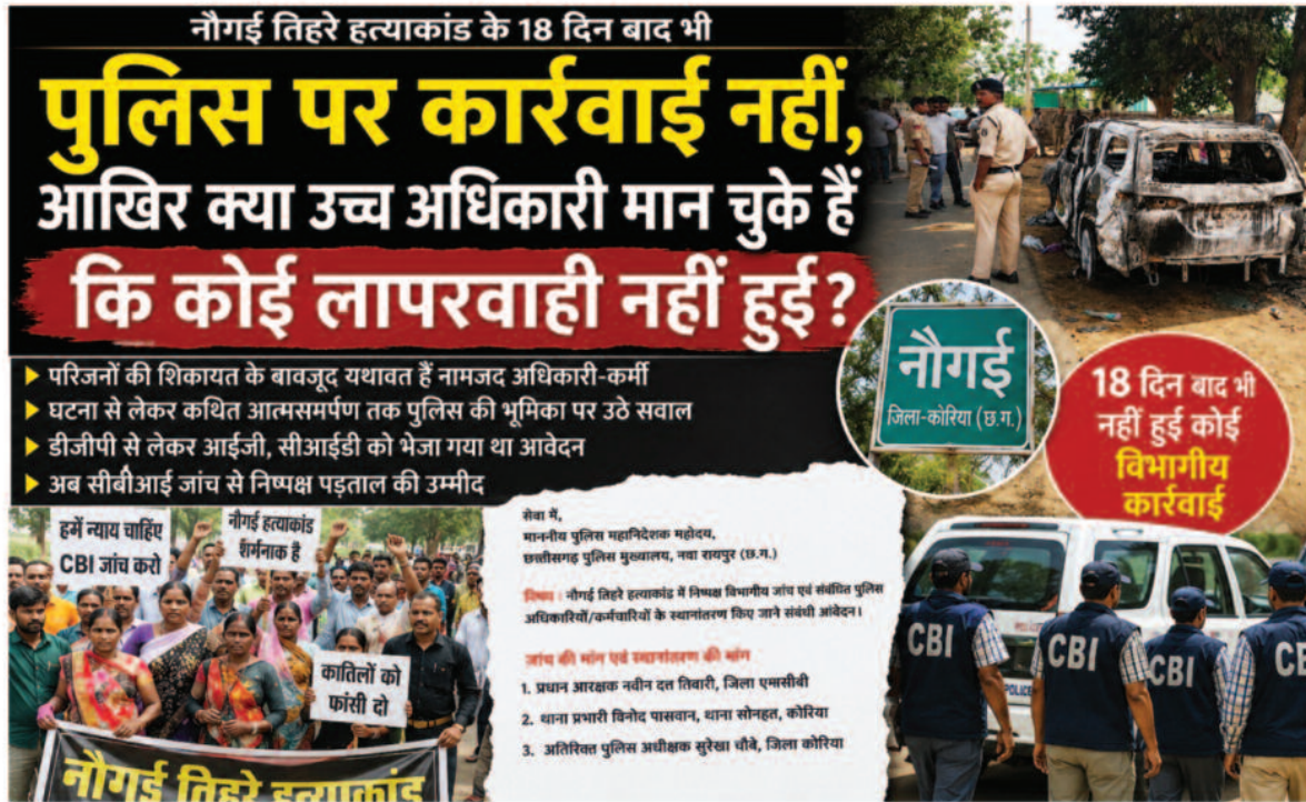
नौगई तिहरे हत्याकांड के 18 दिन बाद भी पुलिस पर कार्रवाई नहीं, आखिर क्या उच्च अधिकारी मान चुके हैं कि कोई लापरवाही नहीं हुई ?