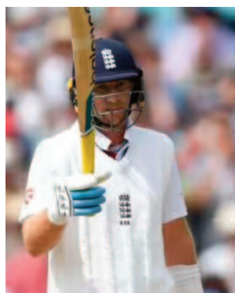
16 साल बाद इस लिस्ट में जो रूट का नाम शामिल हो गया है। 35 साल के रूट

लंदन, 20 जून 2026। इंग्लैंड के कार्यवाहक कप्तान और स्टावर बल्लेबाज जो रूट ने टेस्ट में अपने 14000 रन पूरे कर लिए हैं। इंग्लैंड का सामना ओवल के मैदान पर न्यूजीलैंड से हो रही है। टीम की पहली पारी में रूट 14 हजार रन बनाने से सिर्फ दो रनों से चूक गए थे। दूसरी पारी में अपनी 7वीं गेंद पर मैट हेनरी के खिलाफ सिंगल लेकर रूट ने टेस्ट क्रिकेट में 14 हजार रन पूरे किए।