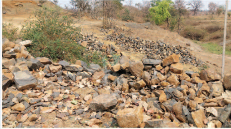
वन मशीनों से खोदे जा रहे पहाड़...कमजोर हो रही जमीन...

स्थानीय लोगों के अनुसार पैनारी क्षेत्र के आसपास स्थित छोटे झाड़ वाले जंगलों और पहाड़ी क्षेत्रों में लंबे समय से अवैध बोल्टर उत्खनन किया जा रहा है, जहां कभी हरियाली और प्राकृतिक वनस्पतियां दिखाई देती थीं, वहां अब बड़े-बड़े गड्ढे और कटे हुए पहाड़ी हिस्से नजर आने लगे हैं, ग्रामीणों का आरोप है कि उत्खनन करने वाले पहले बड़े पत्थरों को आग से गर्म करते हैं और फिर उन्हें थोड़ी-थोड़ी तथा अन्य भारी उपकरणों की सहायता से तोड़कर छोटे-छोटे टुकड़ों में परिवर्तित करते हैं, इसके बाद इन्हें वाहनों के माध्यम से क्रेशर प्लांट तक पहुंचाया जाता है, ग्रामीणों का कहना है कि यह