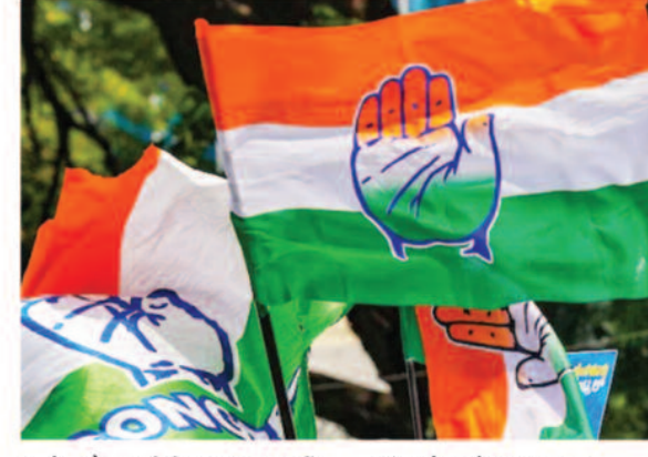
करने और जमीनी स्तर पर पार्टी की सक्रियता बढ़ाने को लेकर अपना खास मार्गदर्शन देंगे।

रायपुर, 07 जून 2026। छत्तीसगढ़ में संगठन को नए सिरे से मजबूत करने और मैदान स्तर पर कार्यकर्ताओं में नई जान फूंकने के लिए प्रदेश कांग्रेस कमेटी ने एक बड़ा मास्टरप्लान तैयार किया है।