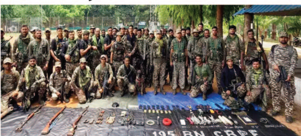
किया गया। सर्चिंग के दौरान सुबह लगभग 8:40 बजे जवानों को जंगल में सदिग्ध वस्तु दिखाई दी।

दत्तेवाड़ा, 07 जून 2026। नक्सल उन्मूलन अभियान के तहत दत्तेवाड़ा पुलिस और सीआरपीएफ को बड़ी सफलता मिली है।