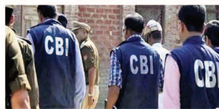
शामिल थे। सीबीआई के अनुसार, जांच में सामने आया है कि कुछ सरकारी अधिकारियों ने बैंक अधिकारियों के साथ मिलीभगत कर खातों को खुलवाने, धनराशि के हस्तांतरण और बाद में उसके दुरुपयोग

नई दिल्ली, 07 जून 2026। केंद्रीय अन्वेषण ब्यूरो (सीबीआई) ने आईडीएफसी फंड्स बैंक और एयू स्मॉल फाइनेंस बैंक से जुड़े सरकारी फंड के गबन के मामले में बड़ी कार्रवाई की है। एजेंसी ने दिल्ली-एनसीआर समेत छह जगहों पर छापे मारे। जांच के दौरान ऐसे सबूत मिले हैं, जिनसे पता चलता है कि सरकारी अधिकारियों ने बैंक अधिकारियों के साथ मिलकर अकाउंट खुलवाने, फंड ट्रांसफर करने और बाद में उसे दूसरी जगह भेजने में मदद की थी। तलाशी अभियान चंडीगढ़, पंचकुला और दिल्ली-एनसीआर स्थित परिसरों में चलाया गया। इनमें हरियाणा कैडर के सीनियर सरकारी अधिकारियों और विपम कंसल्टेंसी प्राइवेट लिमिटेड और उसके डायरेक्टर के घर और ऑफिस