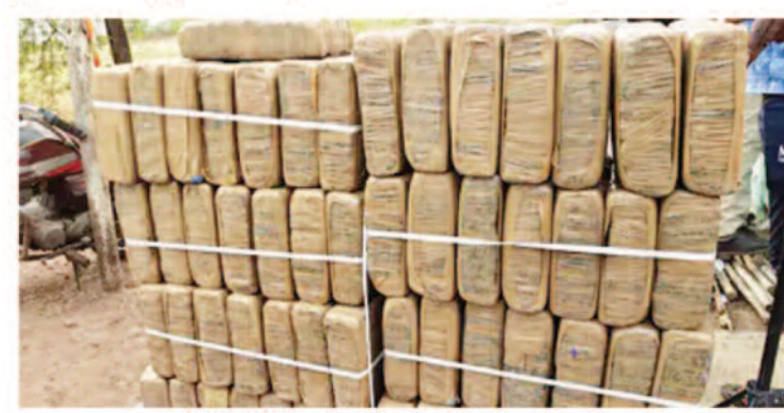
96 पैकेट में पैक थी खेप

धमतरी, 07 जून 2026। छत्तीसगढ़ के धमतरी जिले में पुलिस ने गांजा तस्करी के खिलाफ बड़ी कार्रवाई करते हुए 400 किलो से अधिक गांजा जब्त किया है।