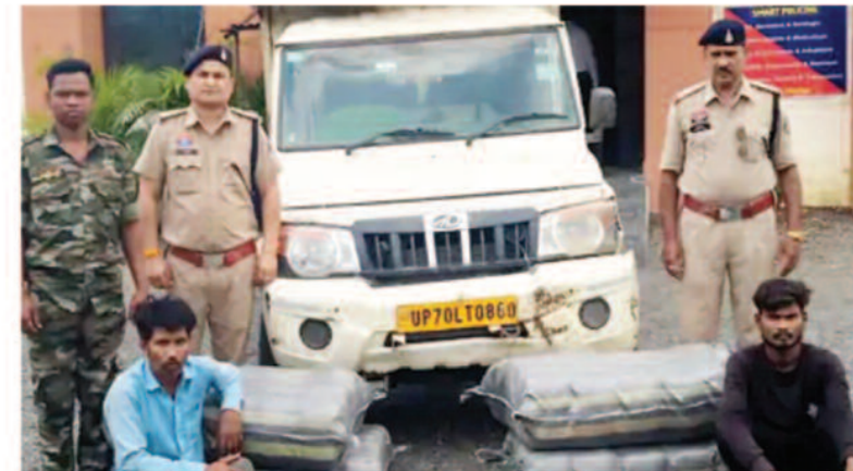
जिला प्रयागराज के रूप में हूँ। जांच के दौरान कटहल के नीचे छिपाकर रखी गईं चार प्लास्टिक बोरियों से कुल 125.700 किलोग्राम गांजा बरामद किया गया।

महासमुंद, 07 जून 2026। छत्तीसगढ़ के महासमुंद जिले में पुलिस ने गांजा तस्करी के खिलाफ बड़ी कार्रवाई करते हुए 125.700 किलोग्राम गांजा जब्त किया है।