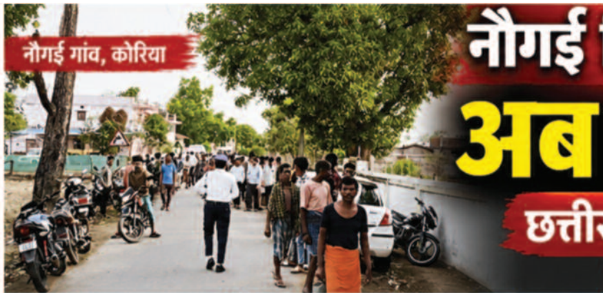
नौगई गांव, कोरिया