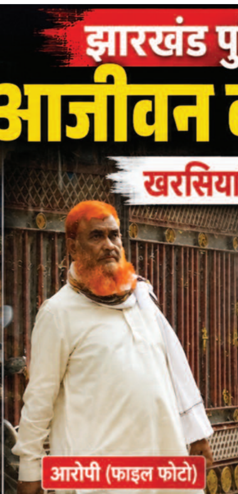
आरोपी (फाइल फोटो)