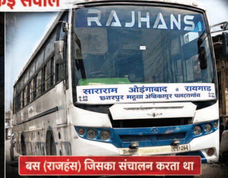
बस (राजहंस) जिसका संचालन करता था