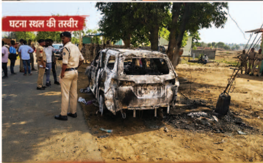
घटना स्थल की तस्वीर