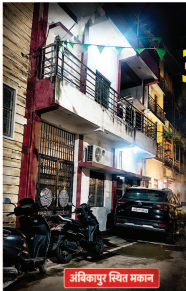
अंबिकापुर स्थित मकान