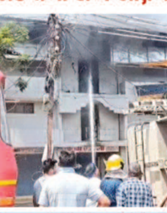
कमिश्नर बोले... गोदाम बनाने की परमिशन है कि नहीं जांच होगी