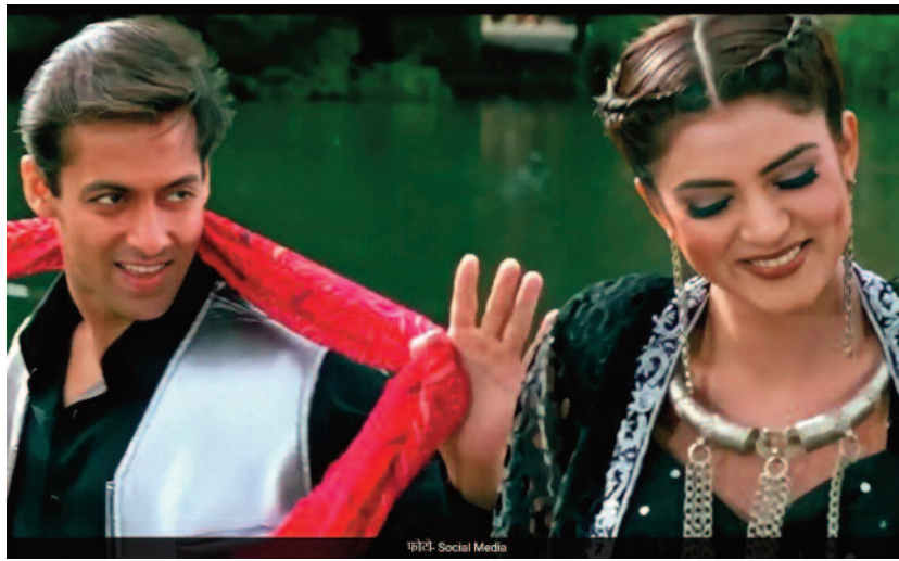
कुछ कहे ही सेट से चली गई थीं। इस बारे में सलमान ने कहा था, एक दिन मैं शूटिंग के पहले

सलमान खान, सुष्मिता संग पहली मुलाकात का किस्सा फारूख शेख होस्टेड शो जीना इसी का नाम है में बताया था कि सेट पर लेट आने के चलते एक्ट्रेस उनसे बहुत नाराज थीं और बिना