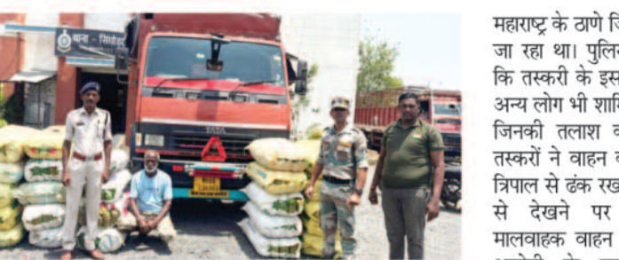
मशीनरी के नीचे छिपा रखा था गांजा

महासमुंद, 30 मई 2026। महासमुंद पुलिस ने मादक पदार्थ तस्करी के खिलाफ एक और बड़ी कार्रवाई करते हुए 600 किलोग्राम गांजा जब्त किया है। इससे पहले 8 मई को एंबुलेंस से 77 किलो और 7 मई को पिकअप वाहन से 1.14 करोड़ रुपए मूल्य का गांजा बरामद किया गया था। अब कंपनी की मशीनरी और कार्टूनों के बीच छिपाकर ओडिशा से महाराष्ट्र ले जाए जा रहे 6 क्विंटल गांजे को गिरफ्तार पुलिस ने एक तस्करी को गिरफ्तार किया है। इस कार्रवाई में गांजा, वाहन, मोबाइल और नकदी समेत कुल 3 करोड़ 12 लाख 15 हजार रुपए की संपत्ति जब्त की गई है। पुलिस के मुताबिक, एंटी नारकोटिक टास्क फोर्स ओडिशा सीमा से लगे अंतरराज्यीय मार्गों और अंदरूनी क्षेत्रों में लगातार निगरानी कर रही थी। इसी दौरान सूचना मिली कि लाल रंग की टाटा