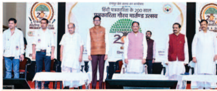
मुख्यमंत्री ने की रायपुर प्रेस क्लब के लिए 1 करोड़ रुपए की घोषणा

मुख्यमंत्री विष्णु देव साय ने कार्यक्रम में अपने संबोधन के दौरान ऐतिहासिक संदर्भ देते हुए बताया कि साल 1836 में देश के पहले हिंदी समाचार पत्र उदंत मार्टेड की शुरुआत कोलकाता से हुई थी, जिसने देश में पत्रकारिता की मजबूत नींव रखी। मुख्यमंत्री ने पत्रकारों को लोकतंत्र का सच्चा सेनानी बताते हुए कहा कि पत्रकारिता ने ही देश में आजादी की अलख जगाई थी। असल मायने में पत्रकारिता ही देश का चौथा स्तंभ है। वहीं पूर्व प्रधानमंत्री अटल बिहारी वाजपेयी को भी याद किया