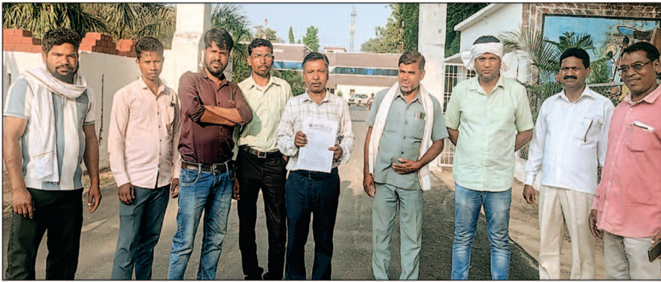
—संवाददाता— सोनहत/कोरिया, 14 मई 2026 (घटती-घटना)।

ग्रामीणों ने मामले में एक और गंभीर पहलू उठाया है, उनका कहना है कि कुशमाहा से मधला तक नई पक्की सड़क की स्वीकृति मिलते ही लकड़ी तस्करो की गतिविधियां बढ़ गईं, ग्रामीणों का आरोप है कि सड़क बनने से पहले ही तस्करो ने यह समझ लिया कि अब लकड़ी की ढुलाई आसान हो जाएगी, यानी विकास की सड़क आने से पहले ही तस्करो ने व्यापारिक सभावना तलाश ली।