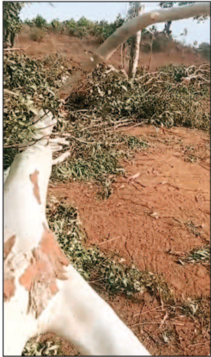
खानापूर्ति वाली जांच पर उठे सवाल

मधला के शमशान घाट में दिनदहाड़े पेड़ों की कटाई, ग्रामीणों में भारी आक्रोश रक्षक ही बने भक्षक? – वन विभाग के कर्मचारी पुत्र और स्थानीय रसूखदार पर लगे गंभीर आरोप