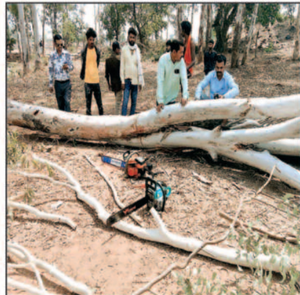
ग्रामीणों के अनुसार ग्राम मधला के शमशान घाट क्षेत्र में वर्षों पहले हरियाली और पर्यावरण संरक्षण के उद्देश्य से यूकेलिप्टस के पेड़ लगाए गए थे, लेकिन अब वही पेड़

मामले को लेकर ग्रामीणों में जबरदस्त नाराजगी है, उन्होंने साफ कहा है कि यदि जल्द दोषियों पर कार्रवाई नहीं हुई और नुकसान की भरपाई नहीं कराई गई, तो बड़ा जन आंदोलन किया जाएगा, ग्रामीणों का कहना है कि आज शमशान की जमीन पर पेड़ कट रहे हैं, कल कोई और सार्वजनिक जमीन कच्चे में ले ली जाएगी, अगर अभी आवाज नहीं उठाई गई, तो आने वाली पीढ़ियों के लिए कुछ नहीं बचेगा।