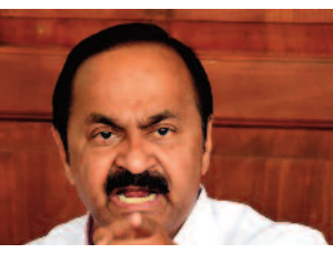
सतीशन की सबसे बड़ी राजनीतिक ताकत उनकी 'डेटा आधारित राजनीति' रही। विधानसभा में उन्होंने सिर्फ राजनीतिक आरोप नहीं लगाए, बल्कि सरकारी आंकड़ों के जरिए पिनारयई विजयन सरकार को घेरा। केरल में बेरोजगारी दर, राज्य का बढ़ता कर्ज, सरकारी संस्थानों में भ्रष्टाचार और कर्णकारण के दौर से चली आ रही गुटबाजी ने कांग्रेस को जनता से दूर कर दिया था। ऐसे समय में राहुल गांधी ने 18 मेष चेत्रिथला की जगह वीडी सतीशन को विपक्ष का नेता बनाया। उस समय यह फैसला जोखिम भरा माना गया, क्योंकि सतीशन के पास न दिल्ली की लॉबी थी और न ही संगठन पर वैसी पकड़, जैसी केसी वेणुगोपाल के पास मानी जाती थी। लेकिन पांच साल बाद वही फैसला कांग्रेस के पुनर्जन्म की सबसे बड़ी वजह बन गया। सतीशन ने विपक्ष का नेता बनने के बाद सबसे पहले कांग्रेस की चुनावी राजनीति की शैली बदली। उन्होंने साफ कहा कि टिकट वितरण में गुटीय वफादारी नहीं, बल्कि जीतने की क्षमता देखी जाएगी। इसका असर स्थानीय निकाय चुनावों में दिखाई दिया। दिसंबर 2025 में हुए स्थानीय निकाय चुनावों में यूडीएफ ने 941 पंचायतों में से 505 पर जीत हासिल की। 87 नगरपालिकाओं में से 54 यूडीएफ के खाते में गईं। 14 जिला पंचायतों में से 7 पर कब्जा हुआ, जबकि 6 में से 4 नगर निगमों में कांग्रेस गठबंधन को सफलता मिली। इन नतीजों ने पहली बार यह संकेत दिया कि एलडीएफ की पकड़ कमजोर हो रही है और कांग्रेस सत्ता में वापसी कर सकती है।