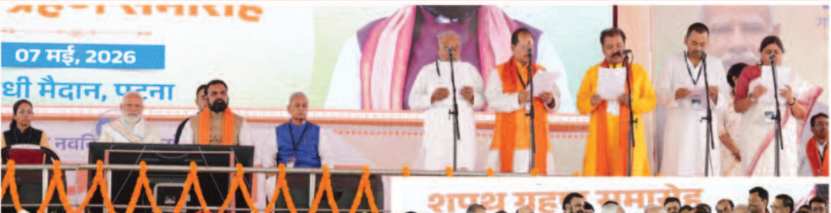
07 मई, 2026 धी मैदान, पटना