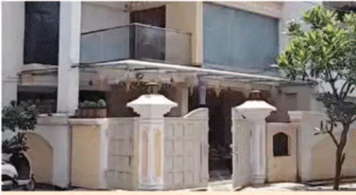
380 करोड़ एपए की संपत्तियां अटैच कर चुकी है ईडी

रायपुर,03 मई 2026। छत्तीसगढ़ शराब घोटाला मामले में प्रवर्तन निदेशालय ने 30 अप्रैल को रायपुर,दुर्ग-भिलाई और बिलासपुर में 13 ठिकानों पर एक साथ छापेमारी की थी। अब तक की कार्रवाई में 53 लाख रुपए कैश, 3,234 किलो सोना और ज़रूरी डॉक्यूमेंट बरामद किए गए हैं। जिसकी कुल कीमत करीब 5 करोड़ 39 लाख रुपये है। यह कार्रवाई प्रिवेंशन ऑफ मनी लॉन्ड्रिंग एक्ट के तहत की गई है। ईडी ने प्रेस रिलीज जारी कर इसकी जानकारी दी। हालांकि किस व्यापारी के घर क्या कितना मिला, यह डिस्कलोज नहीं किया गया है। इस घोटाले में अभी 81 आरोपियों के खिलाफ कोर्ट में सुनवाई चल रही है और अब तक 380 करोड़ की संपत्ति अटैच की जा चुकी है।