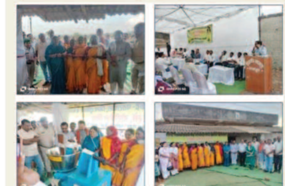
-संवाददाता- बलरामपुर,03 मई 2026 (घटती-घटना)।