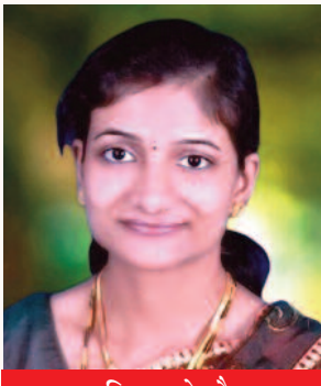
कृति आर.के.जेन बड़वानी, मध्य प्रदेश

चे हरे पर जमी थकान की परतें और आँखों में ठहर गया तनाव कई बार मुस्कान को भी एक औपचारिक अभिनय जैसा बना देते हैं। इसी बीच 04 मई को मनाया जाने वाला वर्ल्ड लाफ्टर डे समय की धारा में एक ऐसा विराम बनकर आता है, जो मन के भीतर मना बोझ को हिलाकर हल्कापन की ओर मोड़ देता है। यह स्पष्ट करता है कि मनुष्य केवल जिम्मेदारियों का बोझ ढोने वाला अस्तित्व नहीं है, बल्कि उसके भीतर एक सहज, जीवंत और स्वतः प्रकट होने वाली ऊर्जा छिपी होती है, जो बिना किसी कारण पूरे वातावरण को हल्का कर सकती है। हँसी कोई सजावटी भाव नहीं, बल्कि भीतर जमे तनाव को पिघलाकर जीवन को पुनः सरल, खुला और सांस लेने योग्य बनाने वाली स्वाभाविक प्रक्रिया है।