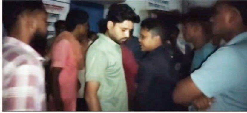
संचालक ने मानी लापरवाही