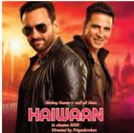
पर सब कुछ ताजगी भरा था, क्योंकि हिंदी फिल्म इंडस्ट्री में ऐसा होता नहीं है कि सब समय पर आ जाएं।

खेर, खेल में यह स्पिरिट जरूरी भी है। सेट का माहौल भी कमाल का था। प्रियदर्शन सर सुबह शूट करना पसंद करते हैं। मैं तो बचपन से सुबह उठने वालों में से रही हूँ। अक्षय और सैफ सर भी सुबह समय पर पहुँच जाते थे। इस सेट