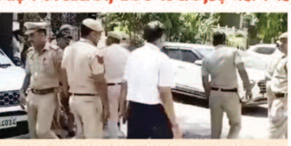
परिजनों को घर के अंदर संदिग्ध हालत में मिली युवती

नई दिल्ली, 22 अप्रैल 2026। दिल्ली के अमर कॉलोनी इलाके में एक सीनियर आईआरएस अफसर के घर में उनकी 22 साल की बेटी की हत्या कर दी गई। पुलिस ने बुधवार को घटना की जानकारी दी। प्रारंभिक जांच में सामने आया है कि युवती के साथ पहले यौन उत्पीड़न किया गया और फिर मोबाइल फोन के चार्जिंग केबल से गला घोटकर उसकी हत्या की गई। सूचना मिलते ही पुलिस टीम मौके पर पहुंची और जांच शुरू की। परिवार ने घर के एक पुराने नौकर पर शक जताया है, जिसे करीब डेढ़ महीने पहले काम से निकाला गया था। संदिग्ध आरोपी फिलहाल फरार बताया जा रहा है।