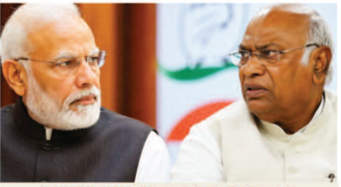
विवाद बढ़ने पर कांग्रेस अध्यक्ष ने क्या सफाई दी थी?

नई दिल्ली, 22 अप्रैल 2026। देश के चुनावी माहौल में कांग्रेस की मुश्किलें बढ़ गई हैं। पार्टी के अध्यक्ष मल्लिकार्जुन खरगे द्वारा प्रधानमंत्री नरेंद्र मोदी के खिलाफ आतंकीवादी वाली टिप्पणी ने अब कानूनी मोड़ ले लिया है। चुनाव आयोग ने इस मामले को गंभीरता से लेते हुए खरगे के खिलाफ सख्त रुख अपनाया है। भारतीय चुनाव आयोग ने बुधवार को मल्लिकार्जुन खरगे द्वारा प्रधानमंत्री मोदी को आतंकीवादी कहे जाने पर गहरा संज्ञान लिया और मामले में नोटिस जारी किया। आयोग के अधिकारियों के अनुसार, इस बयान को आदर्श आचार संहिता का गंभीर उल्लंघन माना गया है। नोटिस में खरगे से अगले 24 घंटों के भीतर अपना पक्ष रखने और स्पष्टीकरण देने को कहा गया है। यह नोटिस तमिलनाडु और पश्चिम बंगाल में होने वाले मतदान से ठीक एक दिन पहले आया है।