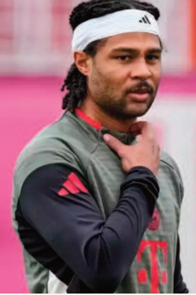
नैगल्समैन के प्लान में उन्हें जरूर शामिल किया गया होगा।

बायर्न, 19 अप्रैल 2026। म्यूनिख के फॉरवर्ड सर्ज ग्नाब्री शायद बाकी सीजन नहीं खेल पाएंगे, जिससे जर्मनी के लिए वर्ल्ड कप में उनका हिस्सा लेना मुश्किल हो गया है। ग्नाब्री की दाहिनी जांच की एडक्टर मसल फट गई है और वह लंबे समय तक बाहर रहेंगे, बायर्न ने शनिवार को यह घोषणा की। क्लब ने और कोई जानकारी नहीं दी, जिससे चोट कितनी गंभीर है और 30 साल के फॉरवर्ड की वापसी का समय पक्का नहीं है। लेकिन ऐसा लगता है कि वह बायर्न के सीजन के बाकी गेम नहीं खेल पाएंगे क्योंकि टीम तीन टूर्नामेंटों जीतने की कोशिश में है। बायर्न के रविवार को बुंडेसलीगा का टाइटल जीतने की संभावना है, अगर वह स्टार्टअप से अपने घर में नहीं हारता है, तो उसके पास टॉफी पकड़ी करने के लिए चार और राउंड होंगे। इसके बाद बायर्न का सामना बुधवार को जर्मन कप सेमीफाइनल में बायर लेवरकुसेन से होगा, जिसके बाद वह चैंपियंस लीग सेमीफाइनल में पेरिस सेंट-जर्मेन पर ध्यान देगा। पिछले वीकेड बायर्न ने बुंडेसलीगा में गोल करने का रिकॉर्ड तोड़ते हुए ग्नाब्री ने आठ गोल किए और सात और गोल में मदद की। उन्होंने जर्मनी के लिए हर वर्ल्ड कप कालिफायर और मार्च में दो फ्रेंडली मैचों में शुरुआत की। मेक्सिको, कनाडा और यूनाइटेड स्टेट्स में होने वाले टूर्नामेंट के लिए कोच जूलियन