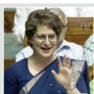
विधेयक ने पूरा... अभी 33% आरक्षण क्यों नहीं दे रहे...

पीएम ने कहा कि मैं आग्रह करूंगा कि सर्वसम्मति से आगे बढ़ाए। इससे ट्रेजरी पर भी दबाव रहता है। मैं इतना ही कहूंगा कि इसको राजनीति के तंत्र से न तोते। देश के इतने बड़े देश का आधा जितना जो उठा रहे है उन्हें रोकना नहीं चाहिए। संख्या के संबंध में भी एकमत पहले से था, कि जो है उतना कम मत करो, ज्यादा कर दो। ताकि किसी को ऐसा न लगे कि मैं छूट गया।