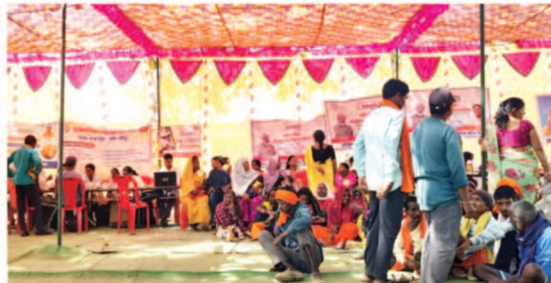
अधिकारी मौन, जनता परेशान

मांग व शिकायत रखने में बहुत ही आसानी होगी, लेकिन इन गांवों की शिकायत में आयोजित किये जाने से बुजुर्ग और बिना बाले वाले गरीब तबके के लोग नहीं पहुँच पाते हैं।