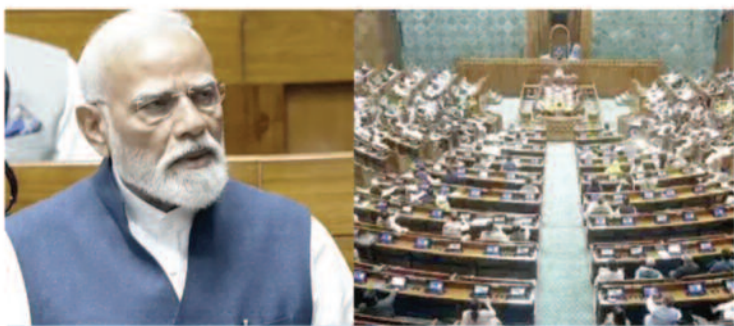
मैं क्रैडिट का ब्लैक चेक दे रहा हूँ : पीएम मोदी

नई दिल्ली, 16 अप्रैल 2026। पीएम मोदी ने गुरुवार को महिला आरक्षण बिल से जुड़े संशोधनों पर कहा कि हमारे देश में जब जब चुनाव आया है उसमें महिलाओं को मिलने वाले इस अधिकार का जिस-जिसने विरोध किया है। उसका हल बुरे से बुरा किया है। कभी माफी नहीं मिली। उन्होंने कहा कि इसलिए जिनको भी इसमें राजनीति की वृत्ति आ रही है वो खुद के परिणामों को देख लें। इसी में फायदा है जो नुकसान हो रहा है उससे बच जाओगे। इसलिए इसे राजनीतिक रंग देने की जरूरत नहीं है। इसलिए हमारी नीयत की खोट को देश की नारी शक्ति माफ नहीं करेगी। इससे पहले अखिलेश यादव ने कहा... अब भारतीय जनता पार्टी नारी को नारा बनाने की कोशिश कर रही है। जिन्होंने नारी को अपने संगठन में नहीं रखा वे उसके मान सम्मान को कैसे रखेंगे। बिलों पर चर्चा के लिए 15 घंटे का समय तय किया गया है। आज 4 बजे वोटिंग की जाएगी। संशोधन बिल में लोकसभा सांसदों की संख्या 850 करने का प्रस्ताव है।