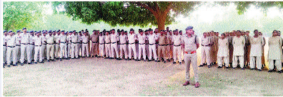
-संवाददाता- सूरजपुर, 16 अप्रैल 2026 (घटती-घटना)।