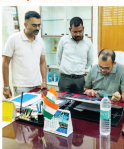
की जाएगी। प्रणाल्य द्वारा घर की स्थिति, सुविधाएं और मूलभूत जानकारी संकलित की जाएगी।

जनगणना का पहला चरण- मकानसूचीकरण एवं मकानों की गणना राज्य में 1 मई से 30 मई 2026 तक किया जाएगा। प्रणाल्य-घर-घर आकर जानकारी दर्ज करेंगे, इसमें हर मकान की जानकारी दर्ज