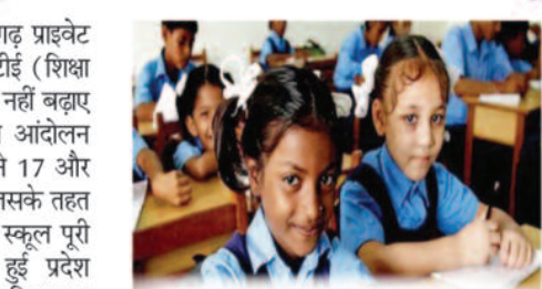
छत्तीसगढ़ में RTE को लेकर बढ़ा विवाद

रायपुर, 16 अप्रैल 2026। छत्तीसगढ़ प्राइवेट स्कूल मैनेजमेंट एसोसिएशन ने आरटीई (शिक्षा का अधिकार) के तहत प्रतिपूर्ति राशि नहीं बढ़ाए जाने के विरोध में अपना असहयोग आंदोलन और तेज कर दिया है। एसोसिएशन ने 17 और 18 अप्रैल को बड़े फैसले लिए हैं, जिसके तहत 18 अप्रैल को प्रदेश के सभी निजी स्कूल पूरी तरह बंद रहेंगे। 17 अप्रैल को हई प्रदेश कार्यकारिणी बैठक में दो अहम निर्णय लिए गए। इसके अनुसार, 17 अप्रैल (शुक्रवार) को सभी स्कूल संचालक और शिक्षक काली पट्टी बांधकर काम करेंगे, जबकि 18 अप्रैल (शनिवार) को पूरे छत्तीसगढ़ में निजी स्कूल बंद रहे जाएंगे। एसोसिएशन ने यह जानकारी स्कूल शिक्षा मंत्री को पहले ही दे दी है। 1 मार्च 2026 से शुरू हुए असहयोग आंदोलन के तहत एसोसिएशन पहले ही फैसला कर चुका है कि स्कूल शिक्षा