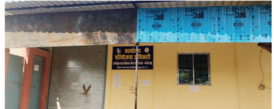
नियम विरुद्ध नियुक्ति के आरोप से बढ़ा विवाद

सूत्रों के अनुसार, परियोजना कार्यालय मनेंद्रगढ़ में कथित रूप से कुछ बिचौलियों और दलालों के संरक्षण में पूरी भर्ती प्रक्रिया को प्रभावित किए जाने की चर्चा है, हालांकि इन आरोपों की