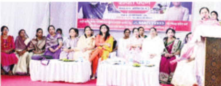
-संवाददाता- कोरिया, 16 अप्रैल 2026 (घटती-घटना)।