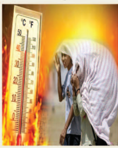
44 डिग्री तक पहुंच सकता है तापमान

मौसम विशेषज्ञों के अनुसार, आने वाले तीन दिनों तक गर्मी से राहत मिलने की संभावना नहीं है। इस दौरान अधिकतम तापमान में 2 से 3 डिग्री तक की और वृद्धि हो सकती है।