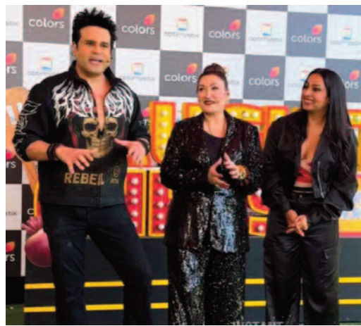
4 साल का वनवास हुआ खत्म

14 साल बाद हुआ गोविंदा फैमिली का रीयूनियन गोविंदा के परिवार में सालों से चली आ रही तकरार अब खत्म हो गई है। सुनीता आहूजा और कृष्णा अभिषेक के बीच रीयूनियन हो गया है। 14 साल बाद सुनीता कृष्णा और कश्मीरा के साथ नजर आई गोविंदा के परिवार में पिछले 14 सालों से चली आ रही के वाहट आखिरकार खत्म हो गई है। हाल ही में सोशल मीडिया पर सामने आए कुछ वीडियो ने फैस को चौंका दिया, जब कृष्णा अभिषेक और कश्मीरा शाह को अपनी मामी, सुनीता आहूजा के साथ बेहद खुशमिजाज अंदाज में देखा गया। सालों पुराने इस झगड़े को भुलाकर परिवार अब हंसी के ठहकों के साथ आगे बढ़ने को तैयार नजर आ रहा है। फैमिली रीयूनियन देखकर फैस भी काफी उत्साहित है। कृष्णा अभिषेक ने भी साफ कह दिया है कि अब 14 साल का वनवास खत्म हो गया है। सुनीता आहूजा और कृष्णा-कश्मीरा का भावुक मिलन बुधवार को मुंबई में लाफ्टर शोप्स अनलिमिटेड एंटरटेनमेंट सीजन 3 के सेट पर एक ऐतिहासिक नजारा देखने को मिला। सालों से एक-दूसरे से दूरी बनाकर रखने वाले कृष्णा अभिषेक और उनकी मामी सुनीता आहूजा आखिरकार एक साथ नजर आए। इस दौरान न केवल उन्होंने एक-दूसरे को गले लगाया, बल्कि पैपरजी के सामने जमकर पोज भी दिए। दिलचस्प बात यह रही कि इस खास मौके पर कृष्णा, कश्मीरा और सुनीता तीनों ही तालमेल बिनाते हुए मैचिंग आउटफिट्स में दिखाई दिए, जिसने इस मिलन को और भी यादगार बना दिया।