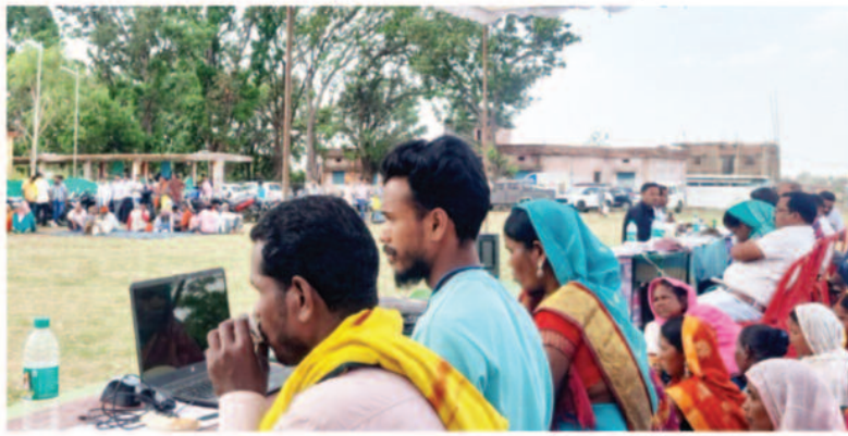
इन गांवों में 'मुदती' से है शिविर की दरकार

कछड़ी - दमज में लगे शिविर - दमज में शिविर लगने से तारा बस्तर, लखी दुधनिया केराइरिया आदि ग्राम के लोगों को लाभ मिलेगा,