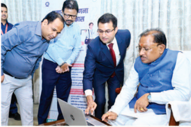
एक मई से घर-घर जाकर जानकारी तैय्य प्रणाली

रायपुर, 16 अप्रैल 2026। मुख्यमंत्री विष्णु देव साय ने राजधानी रायपुर स्थित मुख्यमंत्री निवास में जनगणना 2027 के तहत ऑनलाइन स्व-गणना कर जनगणना अभियान का शुभारंभ किया। इस दौरान उन्होंने स्वयं पोर्टल पर अपनी जानकारी दर्ज कर नागरिकों को इस राष्ट्रीय कार्य में सक्रिय भागीदारी का संदेश दिया। मुख्यमंत्री विष्णुदेव साय ने कहा कि भारत में विश्व का सबसे बड़ा जनगणना अभियान संचालित हो रहा है और छत्तीसगढ़ में भी आज से ऑनलाइन स्व-गणना की प्रक्रिया शुरू हो गई है। नागरिक 16 अप्रैल से 30 अप्रैल 2026 के बीच ऑनलाइन पोर्टल के माध्यम से अपने परिवार से संबंधित जानकारी स्वयं दर्ज कर सकते हैं। इस बार जनगणना को आधुनिक और डिजिटल स्वरूप दिया गया है, जिससे प्रक्रिया अधिक पारदर्शी और सुलभ हो सके।