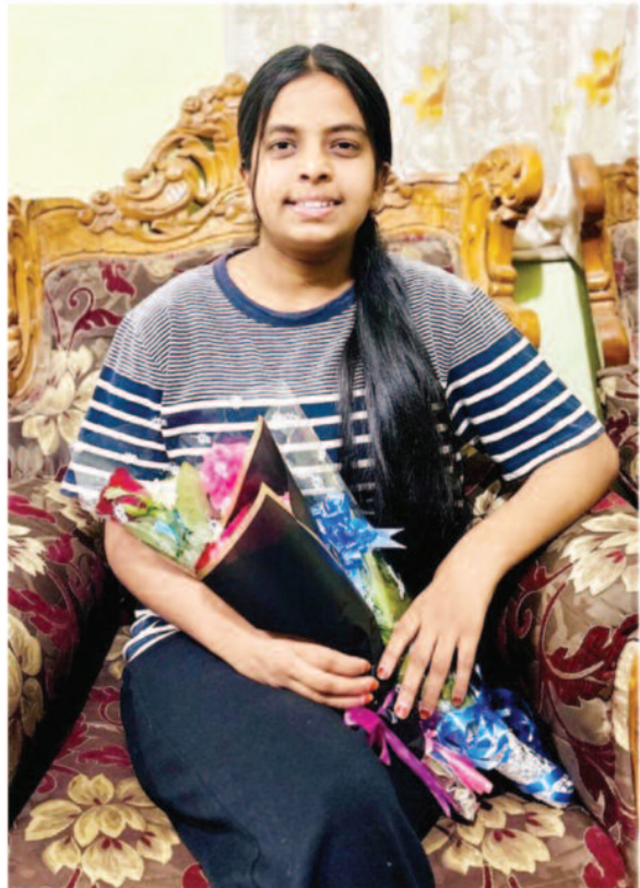
पढ़ाई और व्यायाम को बनाया दिनचर्या का हिस्सा