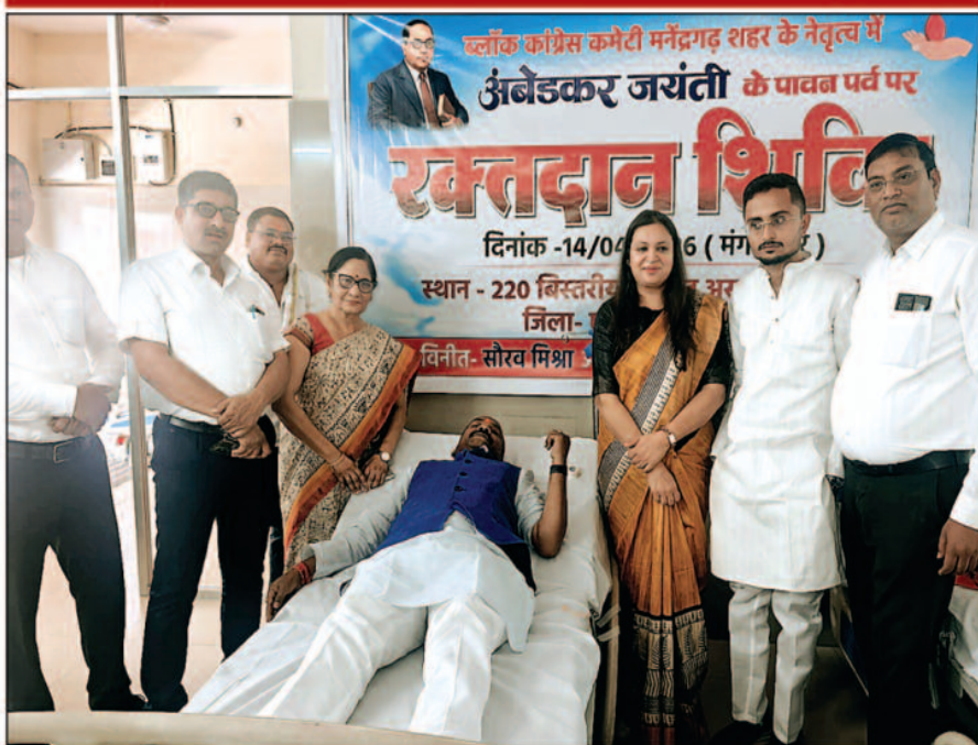
-संवाददाता- मनेंद्रगढ़, 14 अप्रैल 2026 (घटती-घटना)।

मनेंद्रगढ़ में अंबेडकर जयंती के अवसर पर आयोजित रक्तदान शिविर ने सामाजिक सहभागिता और जनसेवा की नई मिसाल पेश की, ब्लॉक कांग्रेस कमेटी मनेंद्रगढ़ शहर के नेतृत्व में 14 अप्रैल को 220 बिस्तरीय सिविल अस्पताल में आयोजित इस शिविर में 50 से अधिक लोगों ने उत्साहपूर्वक रक्तदान किया, आयोजकों के अनुसार यह अब तक का सबसे बड़ा रक्तदान शिविर रहा, जिसमें जनप्रतिनिधियों, युवाओं और आम नागरिकों की सक्रिय भागीदारी देखने को मिली, प्रत्येक रक्तदाता को प्रमाण पत्र देकर सम्मानित किया गया, जिससे लोगों में सेवा भाव और जागरूकता को बढ़ावा मिला।