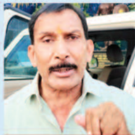
खेमराम बनी सरस्वती मेडिकोज

छत्तीसगढ़ में नकली दवाओं का मामला अब केवल एक अपराधिक घटना नहीं, बल्कि प्रशासनिक जवाब देही, जांच प्रक्रिया और सिस्टम की कार्यशैली पर गंभीर सवाल खड़े करने वाला केस बन चुका है, जिससे 2025 में एक ट्रांसपोर्ट से सदिग्ध दवाओं की बरामदगी से शुरू हुआ यह मामला धीरे-धीरे एक ऐसे नेटवर्क का खुलासा करने लगा, जिसकी जड़ें राज्य की सीमाओं से बाहर तक फैली हुई थीं, इंदौर से छत्तीसगढ़ तक फैले इस कथित सप्लाई नेटवर्क में सरस्वती मेडिकोज, प्रेम प्रकाश मेडिकल एजेंसी और मां बिजासन ट्रेडिंग कंपनी जैसे नाम सामने आए, शुरूआती कार्रवाई में नेटवर्क की संरचना तो उजागर हो गई, लेकिन इसके बाद अपेक्षित तेजी से कार्रवाई नहीं हुई, चार महीनों तक यह मामला जांच, नोटिस और विभागीय प्रक्रियाओं में उलझा रहा, जबकि मुख्य आरोपी खुले घूमते रहे, इसी दौरान स्थानीय अखबार दैनिक घटती-घटना ने इस पूरे मामले को लगातार प्रमुखता से उजागर किया, न केवल नेटवर्क की परतें उजागर की गईं, बल्कि कार्रवाई में देरी, विभागीय निष्क्रियता और जिम्मेदार अधिकारियों की भूमिका पर भी सवाल खड़े किए गए। धीरे-धीरे यह मामला सार्वजनिक चर्चा का विषय बन गया और