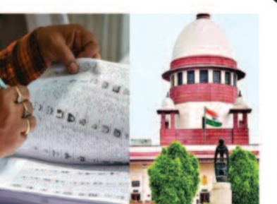
कोर्ट बोला- जीत के अंतर से ज्यादा वोट वोट नहीं डाल पाए तो दखल देंगे

नई दिल्ली, 13 अप्रैल 2026। सुप्रीम कोर्ट ने पश्चिम बंगाल विधानसभा चुनावों में उन वोटों को मतदान करने की इजाजत देने से इनकार कर दिया है जिनके नाम एसआईआर (एसआईआर) के दौरान काट दिए गए हैं। ऐसे वोटों के मामले अपीलिय ट्रिब्यूनलों के पास लंबित हैं। चीफ जस्टिस सुर्यकांत और जस्टिस जॉयमाल्या बागची की बेंच ने कहा कि अगर हम ऐसे वोटों को वोट डालने की इजाजत देंगे तो उन लोगों के वोटिंग अधिकार छीने होंगे जिनके नाम एसआईआर लिस्ट में शामिल हैं। कोर्ट ने कहा कि वोटिंग से 10 दिन पहले, इस स्ट्रेज पर चुनाव प्रक्रिया में कोई दखल नहीं देंगे। सीजेआई ने कहा कि अगर एसआईआर प्रक्रिया को लेकर ऐसे ही आपत्तियां आती रहें, तो चुनाव कैसे होंगे। कलकत्ता हाईकोर्ट ने सुप्रीम कोर्ट को बताया कि 11 अप्रैल तक 34 लाख से अधिक अपीलें दायर की जा चुकी हैं जिनपर फैसला आना बाकी है।