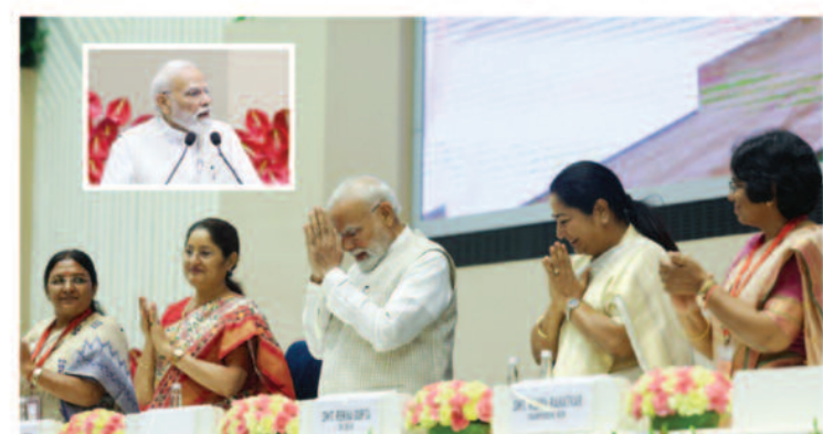
सामाजिक न्याय सिर्फ नारा नहीं रहेगा : पीएम मोदी

नई दिल्ली, 13 अप्रैल 2026। प्रधानमंत्री नरेंद्र मोदी ने सोमवार को कहा कि 'नारी शक्ति वंदन अधिनियम' का लागू होना 21वीं सदी के सबसे महत्वपूर्ण कदमों में से एक है। यह अधिनियम न केवल महिलाओं के सशक्तिकरण की दिशा में ऐतिहासिक पहल है, बल्कि देश के लोकतांत्रिक ढांचे को भी नई मजबूती देगा। प्रधानमंत्री ने विज्ञान भवन में 'नारी शक्ति वंदन सम्मेलन' को संबोधित करते हुए कहा कि भारत की संसद एक नया इतिहास रचने के करीब है, जो अतीत के सपनों को साकार करेगा और भविष्य के संकल्पों को पूरा करेगा। उन्होंने जोर देकर कहा कि यह निर्णय नारी शक्ति को समर्पित है और देश के विकास की यात्रा में महिलाओं की भूमिका अब पहले से कहीं अधिक महत्वपूर्ण हो गई है। प्रधानमंत्री ने अपने संबोधन में महिलाओं की बढ़ती भागीदारी के उदाहरण भी दिए। उन्होंने कहा कि आज देश में राष्ट्रपति से लेकर वित्त मंत्री तक महत्वपूर्ण पदों पर महिलाएं कार्यरत हैं और उन्होंने देश को हर महीने तीन हजार रुपये का भत्ता दिया जाएगा, जबकि किसानों को सालाना 10 हजार रुपये की सहायता दी जाएगी।