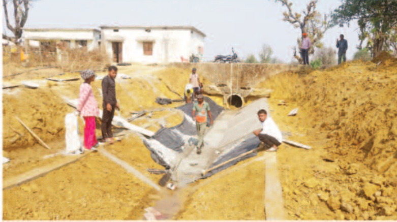
मापदंडों की अनदेखी के आरोप

सिंघत जलाशय का निर्माण लगभग 15 वर्ष पहले किसानों को सिंचाई सुविधा उपलब्ध कराने के उद्देश्य से किया गया था, इस