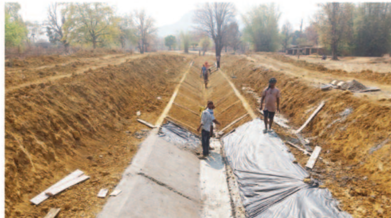
घटिया सामग्री और गलत अनुपात का उपयोग

को लेकर उठ रहे सवाल इन उम्मीदों पर पानी फेर सकते हैं, ग्रामीणों का कहना है कि यदि निर्माण कार्य गुणवत्ता विहीन हुआ, तो पूरी परियोजना का उद्देश्य अधूरा रह जाएगा।