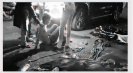
लिप विरामगाम जा रहे थे। सभी लोग सड़क किनारे चल रहे थे। तभी लखतर-विरामगाम हाईवे पर फुल स्पीड में आ रहे एक ट्रक ने पीछे श्रद्धालुओं को कुचल दिया।