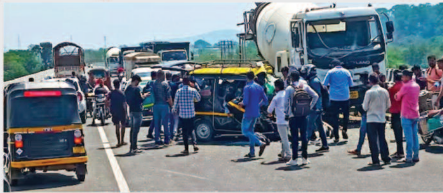
कल्याण से मुंबाई के बीच चलती थी वैन

महाराष्ट्र पुलिस ने इस भयावह सड़क दुर्घटना के कारणों का पता लगाने के लिए मामले की जांच शुरू कर दी है। प्रारंभिक जानकारी और प्रत्यक्षदर्शियों के बयानों के आधार पर, तेज रफतार को दुर्घटना का एक संभावित कारण माना जा रहा है। पुलिस यह भी जांच कर रही है कि कहीं किसी वाहन चालक की लापरवाही या तकनीकी खराबी तो इस बड़े हादसे की वजह नहीं बनी। प्रत्यक्षदर्शियों ने बताया कि हादसा इतना भयावह था कि दुर्घटना के बाद लोगों को बचाने के लिए निकलने में देर तक का माहौल बन गया था। टकराव की आवाज इतनी तेज थी कि आसपास के लोग भी सहम गए थे।