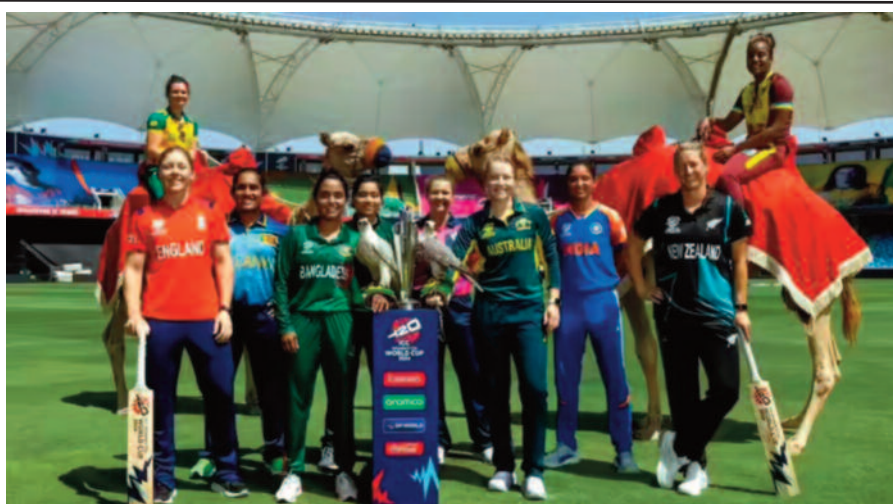
होता है। सेमीफाइनल में हारने वाली टीमों को 675,000 मिलेंगे। हर मैच में जीत हासिल करने पर भी

दुबई, 13 अप्रैल 2026। आईसीसी ने महिला टी20 विश्व कप 2026 की प्राइज मनी का ऐलान कर दिया है। इस बार टूर्नामेंट की कुल प्राइज मनी 8,764,615 यानी करीब 81 करोड़ 83 लाख रुपये होगी। 2024 में हुए पिछले महीने टी20 विश्व कप से यह 10 प्रतिशत ज्यादा है। चैंपियन बनने वाली टीम को 2,340,000 यानी करोड़ 21 करोड़ 84 लाख रुपये मिलेंगे। आईपीएल की विजेता टीम को बीसीसीआई 20 करोड़ रुपये देती है। कम से कम 2 करोड़ 31 लाख हर टीम को मिलेंगे।