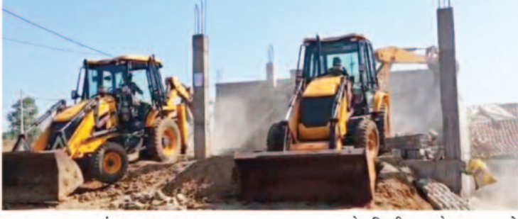
-संवाददाता- अम्बिकापुर/मैनपाट, 10 अप्रैल 2026 (घटती-घटना)।

पक्षपातपूर्ण कार्रवाई का आरोप, कई अवैध कब्जों पर कार्रवाई नहीं होने से नाराजगी