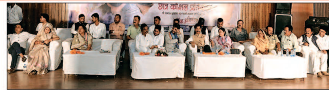
-संवाददाता- सूरजपुर, 10 अप्रैल 2026 (घटती-घटना)।

कार्यक्रम के समापन अवसर पर प्रतियोगिता में उत्कृष्ट प्रदर्शन करने वाले प्रतिभागियों को अतिथियों द्वारा प्रमाण-पत्र एवं पुरस्कार देकर सम्मानित किया गया, इस दौरान छात्रों में उत्साह एवं आत्मविश्वास देखने को मिला।