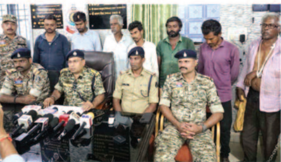
5 आरोपी गिरफ्तार, 2 फरार

राजनांदगांव, 06 अप्रैल 2026। छत्तीसगढ़ में महादेव के बाद साईं सत्र ऐप के ऑनलाइन सट्टा संचालित होने का मामला सामने आया है। आईपीएल शुरू होते ही सट्टेबाज सक्रिय हो चुके हैं। राजनांदगांव पुलिस ने सोमवार को एक हार्डटैक ऑनलाइन सट्टा रैकेट का भंडाफोड़ किया है। फार्महाउस में अवैध तरीक के सट्टा रैकेट संचालित हो रहा था। इससे जुड़े 5 आरोपियों को गिरफ्तार किया गया है, जबकि 2 आरोपी फरार हैं। जानकारी के मुताबिक, फार्महाउस में छपा की कार्रवाई में सामने आया कि यह रैकेट 'साईं ऐप' के माध्यम से हर बॉल और ओवर पर लाखों रुपये का दांव लगावा रहे थे। कोड वक में सट्टा लिखा जा रहा था और पूरा नेटवर्क मोबाइल, लैपटॉप के साथ अन्य डिजिटल उपकरणों के जरिए संचालित हो रहा था।