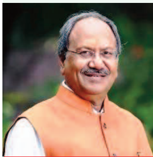
लेखक श्री बृजमोहन अग्रवाल, छत्तीसगढ़ के पूर्व गृहमंत्री एवं वर्तमान में रायपुर लोकसभा से सांसद हैं

छह दशकों तक भारत की आंतरिक सुरक्षा, लोकतांत्रिक व्यवस्था और विकास यात्रा को चुनौती देता रहा नक्सलवाद आज अपने निर्णायक अवसान की अवस्था में पहुँच चुका है। यह केवल एक सुखा सफलता नहीं, बल्कि उस राष्ट्रीय संकल्प की विजय है, जिसमें स्पष्ट नीति, अदृष्ट रणनीतिक इच्छाशक्ति और केंद्र-राज्य के अभूतपूर्व समन्वय ने मिलकर एक जटिल और दीर्घकालिक समस्या का समाधान किया है।