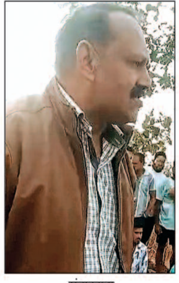
संवाददाता- सूरजपुर, 06 अप्रैल 2026 (घटती-घटना)।