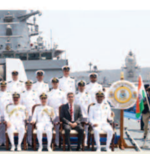
समय के साथ भारत का समुद्र ते रिरता और मजबूत हुआ : रक्षा मंत्री

विशाखापत्तनम, 03 अप्रैल 2026। भारत की समुद्री सुरक्षा को अभेद्य बनाने की दिशा में शुक्रवार को एक नया अध्याय जुड़ गया है। रक्षा मंत्री राजनाथ सिंह ने विशाखापत्तनम स्थित नेवल डॉकयार्ड में स्वदेशी अत्याधुनिक स्टील्थ फ्रिगेट तारागिरी और आईएनएस अरिदमन को नौसेना में शामिल कराया। इस समारोह में सीडीएस जनरल अनिल चौहान, नौसेना प्रमुख एडमिरल दिनेश कुमार त्रिपाठी समेत अन्य वरिष्ठ सैन्य अधिकारी शामिल हुए। राजनाथ सिंह ने कहा... 'जब भी तनाव की स्थिति उत्पन्न हुई है, भारतीय नौसेना ने हमारे वाणिज्यिक जहाजों और तेल टैंकरों की सुरक्षा सुनिश्चित की है। हमारी नौसेना ने यह साबित कर दिया है कि वह न केवल भारत के हितों की रक्षा करने