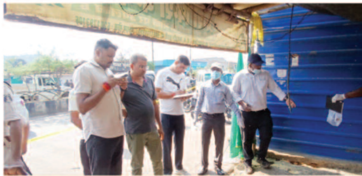
जमीन पर पटकने से गंभीर चोट

पुलिस का अनुमान है कि आरोपी ने महिला के बाल पकड़कर उसे जमीन पर पटक दिया, जिससे उसके चेहरे पर गंभीर चोट आई। महिला का शव अर्धनग्न अवस्था में मिला है, जो घटना की गंभीरता को दर्शाता है।