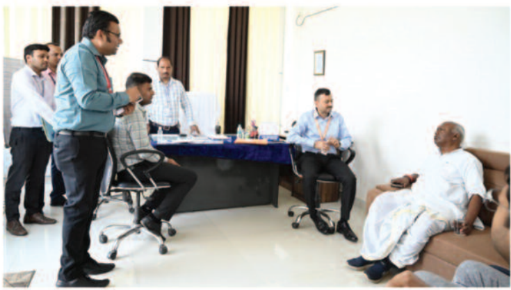
8 माह बाद फिर शुरू हुई सेवा

उत्तर छत्तीसगढ़ की एयर कनेक्टिविटी में 30 मार्च से नया अध्याय जुड़ने जा रहा है। अंबिकापुर के मां महामाया एयरपोर्ट, दरिमा से दिल्ली और कोलकाता के लिए सीधी विमान सेवा शुरू होगी। मुख्यमंत्री विष्णु देव साय वर्चुअल माध्यम से इसका शुभारंभ करेंगे। रविवार को सांसद चितामणि महाराज ने एलायंस एयर के अधिकारियों के साथ एयरपोर्ट का निरीक्षण किया। उन्होंने बताया कि उड़ानों के संचालन के लिए सभी तकनीकी व प्रबंधकीय तैयारियां पूरी कर ली गई हैं। यात्रियों की सुविधा के लिए एयरपोर्ट तक पहुंच मार्ग और पार्किंग व्यवस्था भी दुरुस्त कर दी गई है। सोमवार को दिल्ली से आने वाली फ्लाइट सुबह 11.35 बजे अंबिकापुर पहुंचेगी और 12 बजे दिल्ली के लिए रवाना होगी। यह यात्रा करीब 2 घंटे 10 मिनट में पूरी होगी। सांसद चितामणि महाराज पहले यात्री के रूप में इस उड़ान में शामिल होंगे। विमान सेवा के शुभारंभ के अवसर पर 30 मार्च सुबह 10 बजे पीजी कॉलेज ऑडिटोरियम में कार्यक्रम आयोजित होगा। मुख्यमंत्री वर्चुअल माध्यम से हरी झंडी दिखाएंगे।