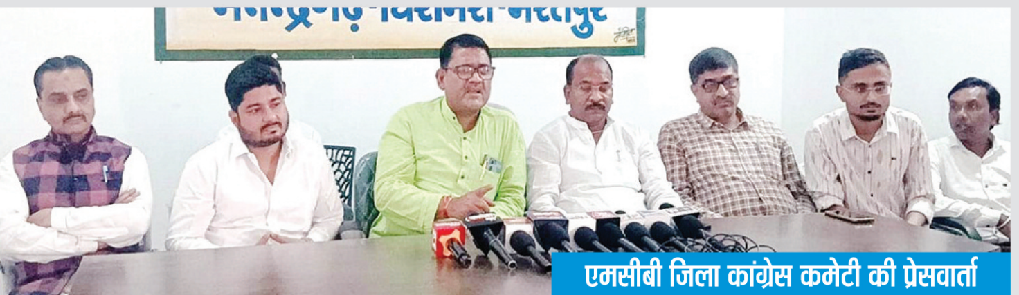
एमसीबी जिला कांग्रेस कमेटी की प्रेसवार्ता