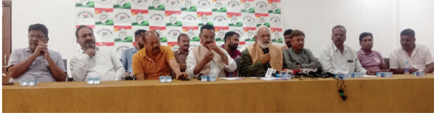
10 एकड़ जमीन पर अफीम की खेती की जा रही थी। इस मामले की जानकारी गांव के सरपंच ने पुलिस को दी थी। मामले के सामने आने के बाद पूर्व मुख्यमंत्री भूपेश बघेल भी मौके पर पहुंचे थे और उन्होंने वहां बड़े पैमाने पर अफीम की खेती देखी। उन्होंने आरोप लगाया कि इतने बड़े स्तर पर अफीम की खेती बिना सरकारी संरक्षण के संभव नहीं है। जिस जमीन पर यह खेती की जा रही थी, उसका मालिक पहले भारतीय जनता किसान मोर्चा का जिलाध्यक्ष रह चुका है।