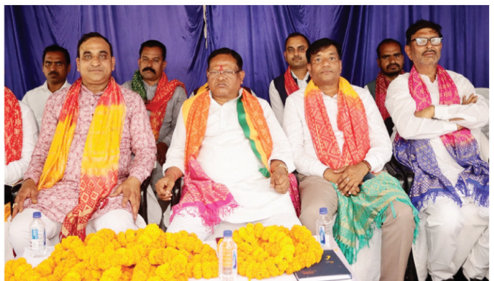
-संवाददाता- सूरजपुर, 08 मार्च 2026 (घटती-घटना)।