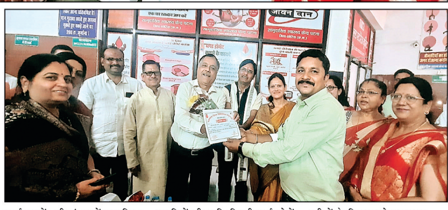
कार्यक्रम में बड़ी संख्या में सामाजिक कार्यकर्ताओं, जनप्रतिनिधियों और नागरिकों की उपस्थिति रही, कई लोगों ने स्वेच्छ से रक्तदान कर जरूरतमंद मरीजों के लिए सहयोग का हाथ बढ़ाया।

अंतर्राष्ट्रीय महिला दिवस के अवसर पर सामाजिक सरोकार का अनुत्तर उदाहरण प्रस्तुत करते हुए जागृति महिला मंडल के तत्वावधान में सामुदायिक स्वास्थ्य केंद्र पटना में रक्तदान शिविर का आयोजन किया गया, इस आयोजन के माध्यम से महिला समूह ने रक्तदान महदान को अपना मुख्य संदेश बनाते हुए समाज में सेवा और मानवता का भाव जगाने का प्रयास किया, महिला दिवस के अवसर पर आयोजित इस