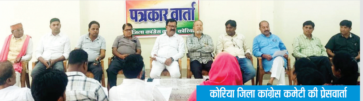
कोरिया जिला कांग्रेस कमेटी की प्रेसवार्ता