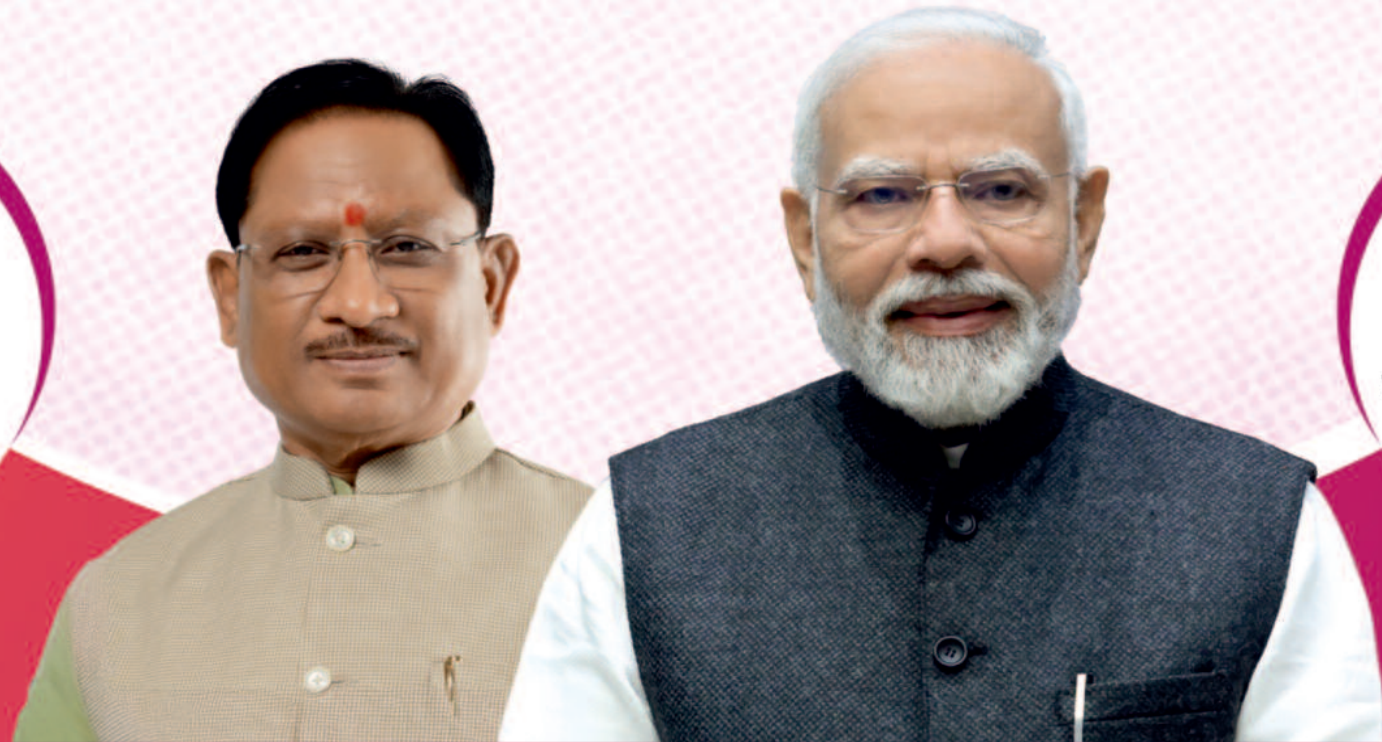
श्री विष्णु देव साय माननीय मुख्यमंत्री, छत्तीसगढ़

प्रायलट प्रोजेक्ट के रूप में महिला स्व-सहायता समूहों को पुनः रेडी टू ईट के कार्य की जिम्मेदारी