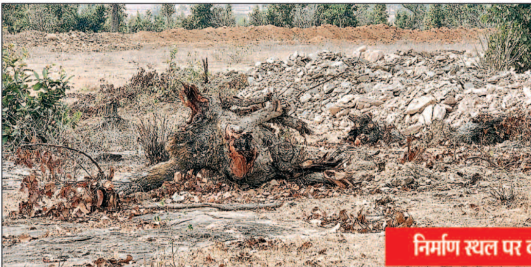
निर्माण स्थल पर कटे गए साल के वृक्ष