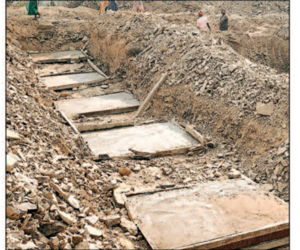
गुणवत्ता विहीन स्लैब