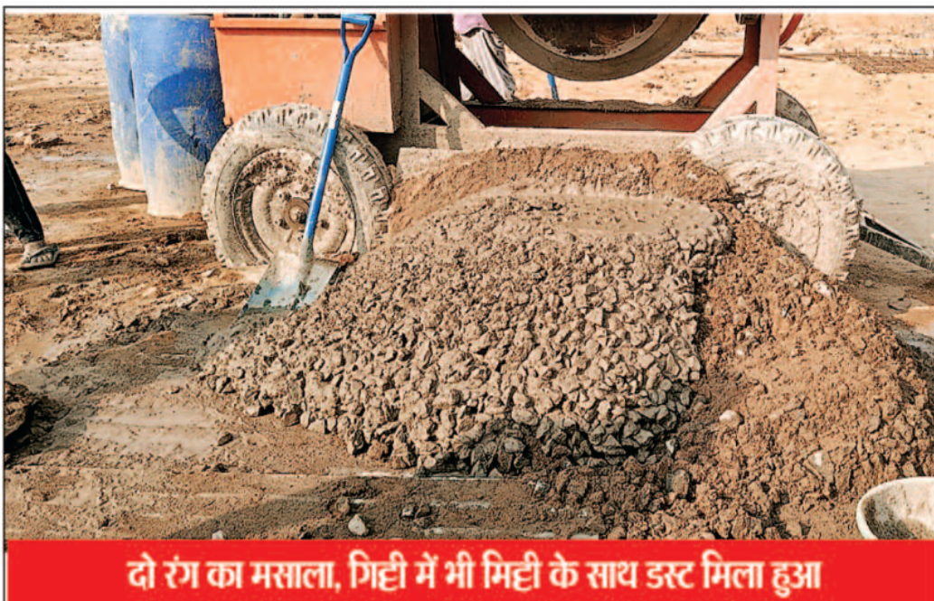
दो रंग का मसाला, मिट्टी में भी मिट्टी के साथ डस्ट मिला हुआ

आदिवासी अंचल के बच्चों को बेहतर शिक्षा और आवासीय सुविधा उपलब्ध कराने के उद्देश्य से बनाई जा रही एकलव्य आदर्श आवासीय विद्यालय परियोजना इन दिनों गंभीर विवादों में घिरती नजर आ रही है, करोड़ों रुपये की लागत से बन रहे इस विद्यालय के निर्माण कार्य को लेकर स्थानीय ग्रामीणों और जानकारों ने कई गंभीर आरोप लगाए हैं, आरोप है कि निर्माण में गुणवत्ता से समझौता, पर्यावरण को क्षति, श्रम कानूनों की अनदेखी और खनिज नियमों का उल्लंघन जैसे कई मामले सामने आ रहे हैं, सबसे हैरान करने वाली बात यह बताई जा रही है कि इस परियोजना को केंद्र सरकार की एजेंसी के माध्यम से संचालित बताया जा रहा है और इसी का हवाला देकर स्थानीय प्रशासन और विभागीय अधिकारियों को हस्तक्षेप से रोका जा रहा है, इससे यह सवाल उठने लगे हैं कि क्या केंद्र की परियोजना होने का मतलब स्थानीय कानूनों और नियमों से ऊपर हो जाना है।