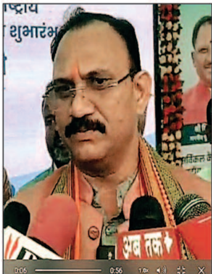
संवाददाता- एमसीबी, 01 मार्च 2026 (घटती-घटना)।