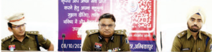
-संवाददाता- अम्बिकापुर, 09 फरवरी 2026 (घटती-घटना)।