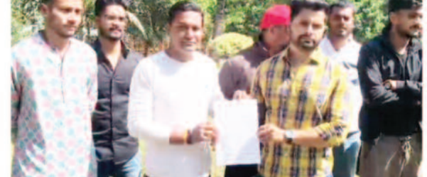
-संवाददाता- अम्बिकापुर, 09 फरवरी 2026 (घटती-घटना)।