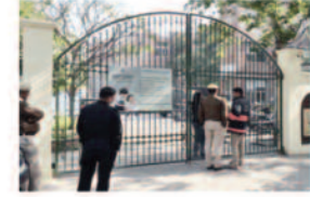
धमकी के बाद स्कूलों में सुरक्षा बढ़ा दी गई है। दिल्ली फायर सर्विस के मुताबिक, सुबह अलग-अलग

इलाकों के स्कूलों से इमरजेंसी कॉल आई। इसके बाद फायर टैंडर, बम निरोधक दस्ते और डॉग स्कवॉड तुरंत मौके पर पहुंची। धमकी भरे ईमेल में लिखा- अफजल गुरु की याद में दिल्ली बनेगा खालिस्तान। 1:11 बजे पर धमका होगा, 13 फरवरी को 1:11 बजे पर संसद में ब्लास्ट होगा। पंजाब खालिस्तान है। खालिस्तान नेशनल आर्मी।