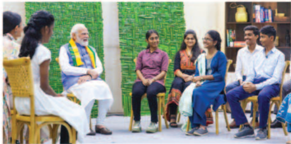
कमजोर क्लासमेट्स की मदद

नई दिल्ली, 09 फरवरी 2026। प्रधानमंत्री नरेंद्र मोदी ने सोमवार को 'परीक्षा पे चर्चा' के 9वें एडिशन के दूसरे एपिसोड में देशभर से आए छात्रों से मुलाकात की। पीएम मोदी कोयंबटूर से छत्तीसगढ़ पहुंचे और बच्चों से बात की। इसके बाद पीएम गुवाहाटी के अटलबिम्बी पहुंचे। पीएम ने कहा कि कभी भी टेक्नोलॉजी का गुलाम नहीं बनना चाहिए। टेक्नोलॉजी का इस्तेमाल क्षमता बढ़ाने में करें। दूसरे एपिसोड में पीएम मोदी ने बच्चों को पढ़ने के साथ, लिखकर प्रैक्टिस करने की सलाह दी। साथ ही बच्चों से कहा कि पहले निडर बनें फिर लौडर बन जाओगे।