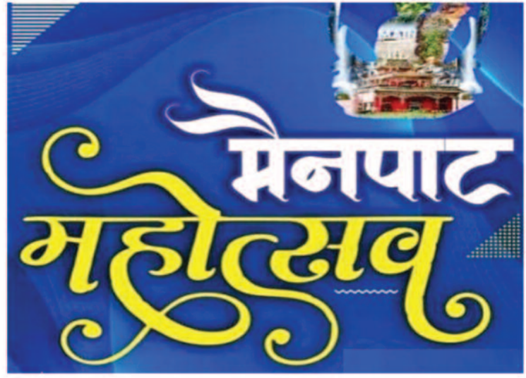
गया था, लेकिन इस बार इसे नए स्वरूप में आयोजित किया जा रहा है। पहले दिन मनोज तिवारी बांधेंगे समारंभ : 13 फरवरी को महोत्सव का शुभारंभ होगा। पहले दिन भोजपुरी सिनेमा के सुपरस्टार और भाजपा सांसद मनोज तिवारी मंच पर प्रस्तुति देंगे। इसके अलावा छत्तीसगढ़ी गायक सुनील सोनी और ओडिशा के प्रसिद्ध छठ नृत्य कलाकार हरिपद मोहंता भी दर्शकों का मनोरंजन करेंगे। स्थानीय

छत्तीसगढ़ का शिमला कहे जाने वाले मैनपाट में पर्यटन को बढ़ावा देने के उद्देश्य से मैनपाट महोत्सव 2026 का आयोजन 13 से 15 फरवरी तक किया जाएगा। तीन दिवसीय इस महोत्सव में इस बार लंबे समय बाद फिर से भव्यता देखने को मिलेगी। महोत्सव का शुभारंभ मुख्यमंत्री विष्णुदेव साय करेंगे। आयोजन की तैयारियां जोर-शोर से चल रही हैं। प्रशासन और पर्यटन विभाग द्वारा इसे आकर्षक बनाने के लिए व्यापक स्तर पर व्यवस्थाएं की जा रही हैं। महोत्सव के दौरान पर्यटकों के लिए एडवेंचर गेम्स, बोटिंग, झुले, भव्य मेला और दंगल जैसे कई आकर्षक आयोजन रखे गए हैं। इसका मुख्य उद्देश्य मैनपाट की पर्यटन गतिविधियों को बढ़ावा देना और अधिक से अधिक सैलानियों को यहाँ आकर्षित करना है। राज्य शासन द्वारा इस आयोजन के लिए 10 लाख रुपए की राशि स्वीकृत की गई है। पिछले कुछ वर्षों में यह आयोजन औपचारिकता तक सीमित रह