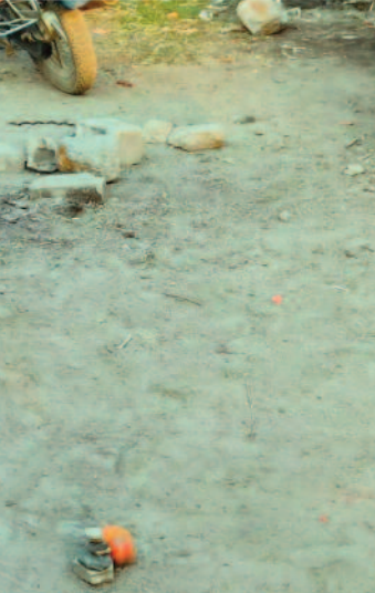
जाते हैं। टीम अरमान को तत्काल श्री सत्य साई नारायण अस्पताल,

पता लगाना और उनका मुफ्त इलाज कराना है, जिसमें श्री सत्य