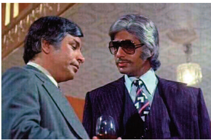
फिल्मों की स्क्रिप्ट भी लिखी है। यह अभिनेता कोई और नहीं बल्कि दिवंगत अभिनेता कादर खान थे।

क्या आपको यकीन होगा कि किसी अभिनेता को सिर्फ सर जी न बुलाने के लिए फिल्म से ही निकाल दिया गया हो? सिनेमा के एक दिग्गज अभिनेता के साथ ऐसा हुआ था। खुद उन्होंने एक इंटरव्यू में खुलासा किया था कि अमिताभ बच्चन को सर जी न बुलाने के लिए उन्हें फिल्म से ही बाहर कर दिया गया था। इस अभिनेता के साथ अमिताभ बच्चन ने कई हिट फिल्में दी हैं। दोनों की जोड़ी ऑन-स्क्रीन खूब पसंद की गई। यही नहीं, ऑफ-स्क्रीन भी दोनों जिगरी दोस्त हो गए थे। मगर सर जी न बुलाने के लिए जब उन्हें फिल्म से बाहर किया गया, उसके बाद से ही दोनों की दोस्ती में दरार पड़ गई। फिर कभी उन्होंने एक-दूसरे से बात नहीं की। इस दिग्गज अभिनेता ने अमिताभ बच्चन की बेनाम, परवरिश, अमर अकबर एंथनी, मुकद्दर का सिकंदर और नसीब जैसी