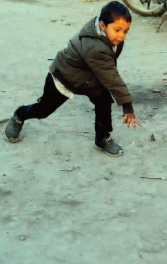
जिंदगी की दिशा बदल दी।

धड़कन सामान्य नहीं थी। यही वह पता लगाता और उनका मुफ्त इलाज कराना है, जिसमें श्री सत्य