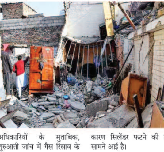
अधिकारियों के मुताबिक, कारण सिलेंडर फटने की बात शुरुआती जांच में गैस रिसाव के सामने आई है।

इस्राइली प्रधानमंत्री बेंजामिन नेतन्याहू और अमेरिकी विदेश मंत्री मार्को रूबियो ने ईरान में अमेरिकी हस्तक्षेप की संभावना के बारे में बात की। वहीं, डेली मेल की रिपोर्ट के मुताबिक डोनाल्ड ट्रंप ने रविवार को अमेरिकी को ग्रैनलैंड पर संभावित आक्रमण के लिए आकरिम्क योजनाएं तैयार करना शुरू करने के निर्देश दिए। हालांकि, ट्रंप के निर्देश पर शीर्ष सैन्य अधिकारियों की ओर से विरोध जताया गया। उन्होंने इसकी वैधता और राजनीतिक व्यवहार्यता दोनों पर सवाल उठा रहे हैं।