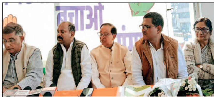
-संवाददाता- मनंदराढ़, 11 जनवरी 2026 (घटती-घटना)।

मनंदराढ़ में आज कांग्रेस पार्टी द्वारा मनरेगा कानून में केंद्र सरकार द्वारा किए गए बदलावों के विरोध