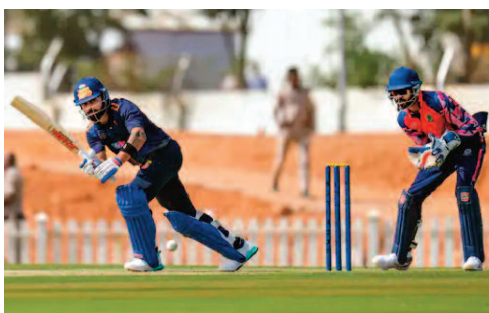
पारी खेली थी। इसके लिए उन्हें प्लेयर ऑफ द मैच भी चुना गया था। पहले मैच के दौरान वे सबसे तेज 16 हजार

नई दिल्ली, 29 दिसम्बर 2025। विराट कोहली विजय हजारों टॉपर्स में एक और मैच खेलते दिखेंगे। रविवार को दिल्ली एवं जिला क्रिकेट संघ के अध्यक्ष रोहन जेटली ने इसकी पुष्टि की। उनके मुताबिक कोहली ने दिल्ली के लिए तीन मैच खेलने की बात कही है। बीसीसीआई के अनुसार सेंट्रल कॉन्ट्रैक्ट वाले खिलाड़ियों को कम से कम दो विजय हजारों मैच खेलने थे, लेकिन कोहली एक अतिरिक्त मैच भी खेलना चाहते हैं। कोहली 6 जनवरी को रेलवेज के खिलाफ मैच खेलेंगे। यह मुकाबला बेंगलूर के सेंटर ऑफ एक्सीलेंस में होगा। पहले मैच में शतक लगाया कोहली ने पहले दो मुकाबलों में शानदार प्रदर्शन किया था। उन्होंने पहले ही मैच में सेंचुरी लगाते हुए 131 रन बनाए थे। वहीं दूसरे मैच 77 रन की