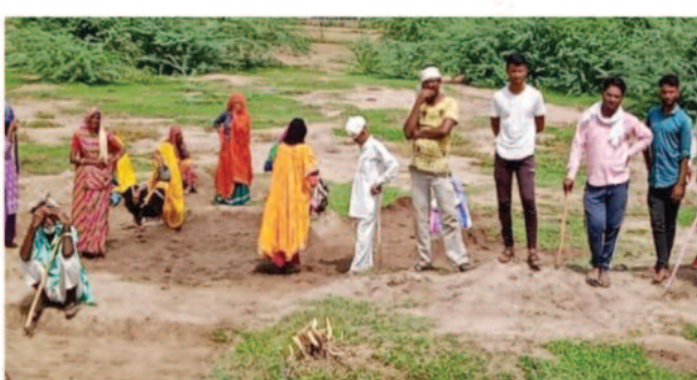
ग्राम सभाओं में फैलाए जा रहे मम का जवाब...

रायपुर, 28 दिसम्बर 2025। छत्तीसगढ़ में मनरेगा कानून में किए गए संशोधन के खिलाफ कांग्रेस 5 जनवरी से प्रदेशव्यापी आंदोलन शुरू करने जा रही है। इसके तहत कांग्रेस नेता और कार्यकर्ता गांव-गांव जाकर ग्राम पंचायतों में लोगों को मनरेगा में हुए बदलाव और उससे पड़ने वाले असर के बारे में बताएंगे। यह फैसला दिल्ली में हुई कांग्रेस वरिष्ठ कमिटी की बैठक में लिया गया, जहां देशभर में मनरेगा के विरोध का ऐलान किया गया है। प्रदेश कांग्रेस का कहना है कि केंद्र सरकार ने मनरेगा के मूल स्वरूप से छेड़छाड़ की है। इसके जवाब में छत्तीसगढ़ की हर ग्राम पंचायत में जागरूकता अभियान चलाया जाएगा। कांग्रेस मजदूरों को बताएगी कि नए कानून से काम की गारंटी कैसे कमजोर हो रही है और इसका सीधा असर उनकी रोजी-रोटी पर पड़ेगा।