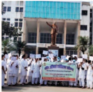
नर्सिंग ऑफिसर्स की 11 मुख्य मांगें

रायपुर, 28 दिसम्बर 2025। छत्तीसगढ़ कर्मचारी अधिकारी फेडरेशन के आह्वान पर नर्सिंग ऑफिसर्स एसोसिएशन छत्तीसगढ़ के सदस्यों ने प्रदेश के सभी चिकित्सा महाविद्यालय से संबद्ध चिकित्सालयों में 29, 30 और 31 दिसंबर को होने वाले निश्चितकालीन आंदोलन के लिए फॉर्म भर दिए हैं। यानी कल से अगले 3 दिन तक नर्सिंग स्टाफ आंदोलन में रहेगा। यह संघ के चरणबद्ध आंदोलन का चौथा चरण है। संघ ने स्पष्ट किया है कि यदि 3 दिन के आंदोलन के बाद भी शासन ने मुख्य मांगों पर संवेदनशीलता नहीं दिखाई, तो प्रदेश स्तरीय अनिश्चितकालीन आंदोलन किया जाएगा। जिससे अस्पतालों का कामकाज पूरी तरह प्रभावित होगा।