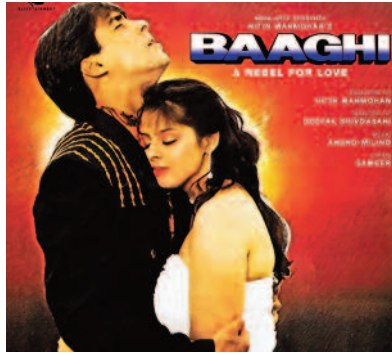
एक सफल अभिनेत्री के तौर पर नहीं, बल्कि एक ऐसी लड़की के रूप में भी बनीं, जिसने अपने दम पर बहुत ही कम उम्र में ये स्टारडम हासिल किया। नगमा ने सलमान खान के साथ फिल्म बागी साइन की थी और तब उनकी उम्र

सलमान खान के अपोजिट डेब्यू कर इस एक्ट्रेस की किस्मत चमक गई, जिन्होंने रजनीकांत, चिरंजीवी जैसे कई सुपरस्टार संग काम किया है। उन्होंने हिंदी, तमिल, तेलुगु, भोजपुरी, मलयालम और कन्नड़ फिल्म इंडस्ट्री में दमखम दिखाया, लेकिन बाद में एक्टिंग को अलविदा कह दिया। फिल्म इंडस्ट्री में हर साल नए चेहरे आते हैं, जिसमें से कुछ स्टार बनाने का मौका मिलता है तो वहीं, कुछ हिट होते ही फिल्मी दुनिया से गायब हो जाते हैं। आज हम उसी एक्ट्रेस की बात कर रहे हैं, जिन्होंने बहुत ही कम उम्र में शोहरत कमा ली। सलमान खान की हीरोइन बन लाइमलाइट में आई ये एक्ट्रेस कोई और नहीं बल्कि 90 के दशक की नगमा हैं, जो आज रलैमर की दुनिया से दूर हैं। उनकी पहचान सिर्फ