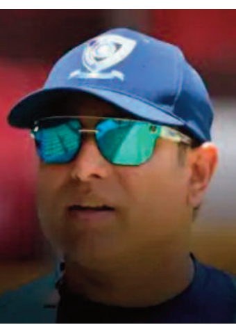
सच्चाई नहीं है। बीसीसीआई इसका सीधा खंडन करता है। यह

सिर्फ कल्पना पर आधारित खबर है। लक्ष्मण को कोच बनाए जाने की खबर हाल के दिनों में कई मीडिया रिपोर्ट्स में दावा किया था कि टेस्ट टीम के खराब प्रदर्शन के बाद वीवीएस लक्ष्मण को अगला टेस्ट कोच बनाया जा सकता है। यह अटकलें ऐसे समय में सामने आईं, जब भारत को घर में साउथ अफ्रीका से 2-0 से टेस्ट सीरीज गंवानी पड़ी। इससे पहले न्यूजीलैंड के खिलाफ भी टीम को 0-3 से हार का सामना करना पड़ा था।