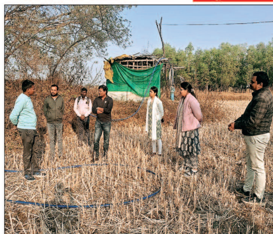
फसलों को अपनाकर किसान भविष्य की चुनौतियों का बेहतर सामना कर सकते हैं।

जिले में टिकाऊ कृषि को बढ़ावा देने के उद्देश्य से कलेक्टर एस. जयवर्धन ने शनिवार को प्रतापपुर एवं भैयाथान विकासखंड के विभिन्न गांवों का भ्रमण किया, इस दौरान उन्होंने रबी फसलों की स्थिति का अवलोकन किया और डीएमएफ योजना के अंतर्गत स्थापित नलकूपों का निरीक्षण किया, भ्रमण के दौरान कलेक्टर ने कृषक बंधुओं को फसल विविधीकरण अपनाते के लिए प्रेरित किया, कलेक्टर एस. जयवर्धन का यह भ्रमण स्पष्ट संदेश देता है कि जिले में कृषि को जल-संरक्षण, फसल विविधीकरण और दीर्घकालीन लाभ की दिशा में आगे बढ़ाया जा रहा है, डीएमएफ नलकूपों के प्रभावी उपयोग और वैकल्पिक