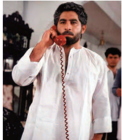
बनाया था और इसकी कहानी पहले की मशहूर लेखक जोड़ी सलीम-जावेद ने लिखी थी

ताहिल ने बताया कि शान का मशहूर शेविंग सीन, जिसमें उनका सामना अमिताभ बच्चन से होता है, किसी मेनस्ट्रीम बॉलीवुड फिल्म के लिए उनका पहला शॉट था। फिल्म के इस मुकाम पर पहुंचने पर खुशी जाहिर करते हुए, ताहिल ने अपने ऑफिशियल इंस्टाग्राम हैंडल पर एक तस्वीर शेयर की और लिखा, शान आज 45 साल पूरे कर रही है और यह फिल्मों में मेरे अपने की सालगिरह भी है। जी. पी. सिप्पी ने सिप्पी फिल्म के प्रोडक्शन बैनर तले इस ड्रामा को