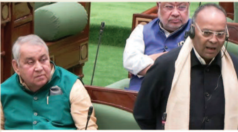
उद्योग नीति में छत्तीसगढ़ की झलक नहीं : अजय चंद्राकर

रायपुर, 14 दिसम्बर 2025। छत्तीसगढ़ विधानसभा के शीतकालीन सत्र के पहले दिन सदन में कार्यवाही के बीच एक बिल्ली घुस आई। इस वक्त वित्त मंत्री ओपी चौधरी विजन डॉक्यूमेंट पर संबोधन दे रहे थे। मंत्री जैसे-जैसे बोल रहे थे, वैसे-वैसे बिल्ली की प्याऊ-प्याऊ तेज हो रही थी। इसे सुनकर मंत्री विधायक करीब 5 मिनट तक ठहके लगाते रहे। इस दौरान कृषि मंत्री रामविचार नेताम, वित्त मंत्री की ओर देखकर मुस्करा उठे। स्पीकर, मंत्री, विधायक और अफसर भी कुछ देर तक हंसी नहीं रोक पाए। बाद में कर्मचारियों ने बिल्ली को बाहर निकाला, तब जाकर सदन की कार्यवाही सामान्य रूप से आगे बढ़ सकी। नए विधानसभा भवन में 'विजन 2047' पर चर्चा हुई, लेकिन कांग्रेस ने पहले दिन सत्र का बहिष्कार किया। इस पर वित्त मंत्री ओपी चौधरी ने कहा कि कांग्रेस डूबती हुई नाव है। इस नाव का डूबना तय है, इसलिए सत्ता पक्ष और भारतीय जनता पार्टी पूरी जिम्मेदारी के साथ आगे बढ़ रही है।