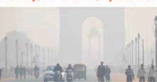
ऐसी गतिविधियां जारी रखना बच्चों के लिए 'गंभीर स्वास्थ्य खतरा' साबित हो सकता है। डॉक्टर भी लगातार लोगों को सतर्क रहने की

नई दिल्ली, 14 दिसम्बर 2025 दिल्ली-एनसीआर में हवा की स्थिति बेहद खराब हो गई है। एक्यूआई 497 पहुंचने के बाद और सख्ती लागू कर दी गई है। कमीशन फॉर एयर क्वालिटी मैनेजमेंट ने सभी राज्य सरकारों को आदेश दिया है कि सभी स्कूलों और संस्थानों में बाहर होने वाली खेल गतिविधियों को तुरंत रोकना जाए। आयोग ने चेतावनी दी है कि