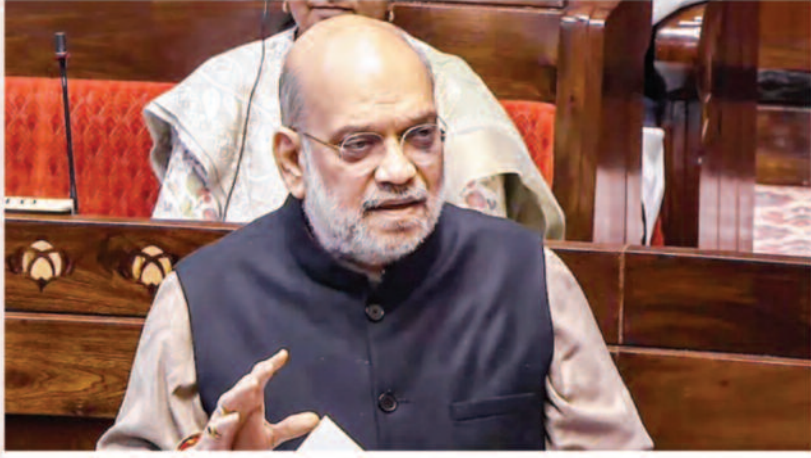
शाह ने कहा- तिरंगा फहराते वक्त वंदे मातरम् का कहना भूलना नहीं

नई दिल्ली, 09 दिसम्बर 2025। राज्यसभा में राष्ट्रीय गीत 'वंदे मातरम्' पर मंगलवार को चर्चा हुई। गृह मंत्री अमित शाह ने कहा- जो लोग वंदे मातरम् के महत्व को नहीं जानते वे इसे चुनाव से जोड़ रहे हैं। शाह के बयान को प्रियंका गांधी ने कहा था- वंदे मातरम् गीत 150 साल से देश की आत्मा का हिस्सा है। आज इस पर बहस क्यों हो रही है? मैं बताती हूँ- क्योंकि बंगाल का चुनाव आ रहा। मोदी जी उसमें अपनी भूमिका निभाना चाहते हैं। शाह ने संबोधन में कहा- जब वंदे मातरम् 100 साल का हुआ, पूरे देश को बंटी बना दिया गया। जब 150 साल पर कल सदन (लोकसभा) में चर्चा शुरू हुई, गांधी परिवार के दोनों सदस्य (राहुल-प्रियंका) नदारद थे। वंदे मातरम् का विरोध नेहरू से लेकर आज तक कांग्रेस नेतृत्व के खून में है। दरअसल राष्ट्रगीत वंदे मातरम् के 150 साल पूरे होने के मौके पर भारत सरकार की ओर से सालभर का कार्यक्रम आयोजित किया जा रहा है। 2 दिसंबर को लोकसभा स्पीकर ओम बिरला ने सभी दलों के प्रतिनिधियों को मीटिंग बुलाई थी। इसमें तय किया गया था कि वंदे मातरम् को लेकर 8 दिसंबर को लोकसभा और 9 दिसंबर को राज्यसभा में चर्चा होगी।