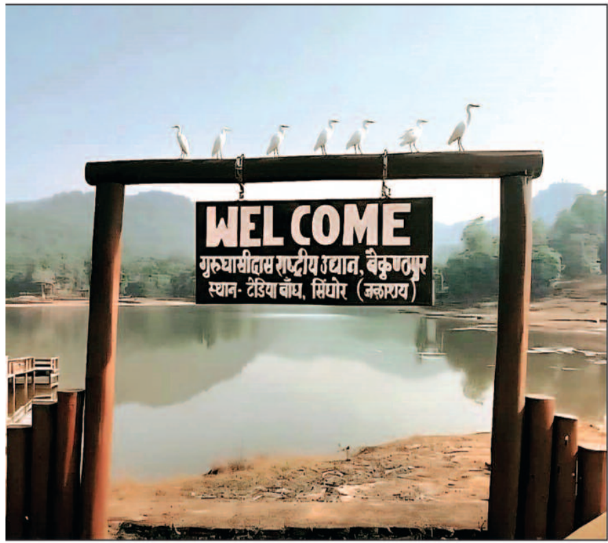
(वेलकम बोर्ड पर बैठे पक्षी)- गुरुघासीदास राष्ट्रीय उद्यान के टैडिया डेम में स्वागत पट्टी पर विराम लेते प्रवासी पक्षी सर्दियों की सुबह का अद्भुत दृश्य...

परिंदों की कोमल हवा और डूबते सूरज की सुनहरी रोशनी के बीच रविवार की शाम सिंचेर के टैडिया जलाशय में प्रकृति मानो गीत बन गई, गुरु घासीदास राष्ट्रीय उद्यान के रामगढ़ परिक्षेत्र में बसे इस शांत जलाशय पर दो भ्रम-अलगा झुंड में प्रवासी पक्षियों का कलरव गुंजा-और दृश्य इतना मनोहारी था मानो पर्वतीय प्रतिध्वनि में स्त्री प्रेम की धुन छेड़ रहे हों, स्थानीय लोग कहते दिखे-बड़ी दूर से आये हैं...प्यार का तोहफा लाए हैं।