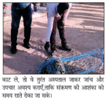
काट ले, तो वे तुरंत अस्पताल जाकर जांच और उपचार अवश्य कराएँ, ताकि संक्रमण की आशंका को समय रहते रोका जा सके।

पर हटाया जा रहा है। उन्होंने कहा कि यह अभियान चरणबद्ध तरीके से आगे भी जारी रहेगा, ताकि शहर में कुत्तों से जुड़ी दुर्घटनाओं और रेबीज संक्रमण के जोखिम को कम किया जा सके। उन्होंने नागरिकों से अपील की कि किसी भी आवारा कुत्ते को अपने स्तर पर पकड़ने की कोशिश न करें, क्योंकि ऐसा प्रयास खतरनाक हो सकता है। बच्चों को विशेष रूप से ऐसे कुत्तों से दूर रखने की सलाह दी गई है। सीएमओ ने यह भी कहा कि यदि किसी नागरिक व बच्चों को कुत्ता