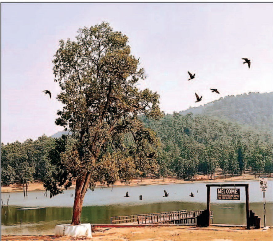
(लकड़ी के बिज च उड़ते पक्षी) - टैडिया डेम के बीचों बीच बने लकड़ी के वॉकवे पर शांत जल में तैरते प्रवासी मेहमान - प्राकृतिक पर्यटन की अनोखी अनुभूति।

नवंबर से मार्च के बीच, जब उत्तरी और मध्य एशिया में कड़के की ठंड छ जाती है, यही पक्षी अपेक्षाकृत गर्म, भोजन-समृद्ध और सुरक्षित स्थानों की तलाश में लंबी दूरी तय करते हैं, टैडिया डेम जैसे जलाशय इन्हें सुरक्षित आश्रय, पर्याप्त भोजन (जलीय कीट, छोटे जीव, जलकाई) शांत जलवायु प्रदान करते हैं, इसलिए भारत के अनेक जलाशय सरीसृप डेम, प्रतापगढ़, और विश्व प्रसिद्ध भरतपुर का केवलादेव घाना राष्ट्रीय उद्यान हर वर्ष इन प्रवासी मेहमानों से गुलजार होते हैं।