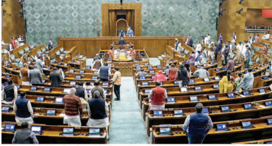
वंदे मातरम् का स्मरण इस सदन का सौभाग्य : मोदी

नई दिल्ली, 08 दिसम्बर 2025। पीएम मोदी ने सोमवार को लोकसभा में वंदे मातरम् के 150 साल पूरे होने पर चर्चा की शुरुआत की। उन्होंने एक घंटे की सपीच में कहा 'वंदे मातरम् अंग्रेजों को करारा जबाब था, ये नारा आज भी प्रेरणा दे रहा। आजादी के समय महात्मा गांधी को भी यह पसंद था। उन्हें यह गीत नेशनल एंथम के रूप में दिखता था। पीएम ने कहा, उनके लिए इस गीत को ताकत बढ़ी थी। फिर पिछले दशकों में इसके साथ इतना अन्याय क्यों हुआ। वंदे मातरम् के साथ विश्वासघात क्यों हुआ। वो कौन सी ताकत थी, जिसकी इच्छा पूज्य बापू की भावनाओं पर भी भारी पड़ी। पीएम मोदी ने एक घंटे की सपीच में वंदे मातरम् 121 बार, देश 50, भारत 35, अंग्रेज 34, बंगाल 17, कांग्रेस का 13 बार जिक्र किया। उन्होंने वंदे मातरम् के रचयिता बंकिम चंद्र चटर्जी का नाम 10 बार, नेहरू 7 बार, महात्मा गांधी 6 बार, मुस्लिम लीग 5 बार, जिन्ना 3 बार, संविधान 3 बार, मुसलमान 2 बार, तुष्टिकरण 3 बार कहा।