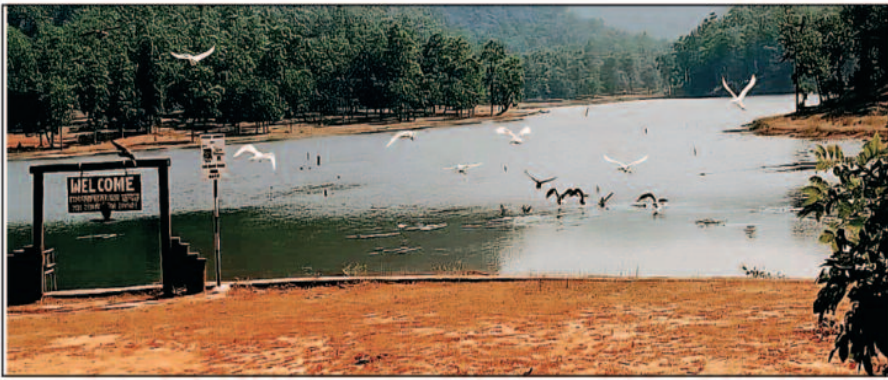
(ऊँची उड़ान वाला वाइड शॉट) - टैडिया डेम के शांत जल और हरियाली के बीच आसमान में उड़ान भरते प्रवासी पक्षियों के झुंड - सर्दियों में लौट आया प्रकृति का संगीत।