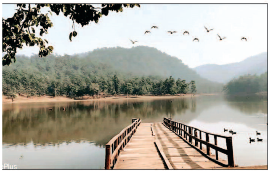
(लकड़ी का बिज च उड़ते पक्षी) - पहाड़ों के बीच बसे टैडिया डेम पर उड़ान भरते प्रवासी पक्षियों का मनोहारी दृश्य - राष्ट्रीय उद्यान क्षेत्र में प्रकृति का संतुलन लौटने का संकेत।