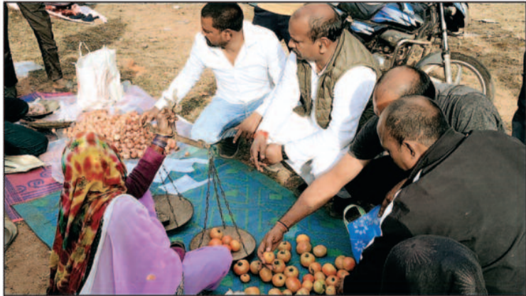
बाद में बिना नोटिस सब तोड़े दिया गया। हमारी सुनने वाला अब कोई नहीं, पूर्व