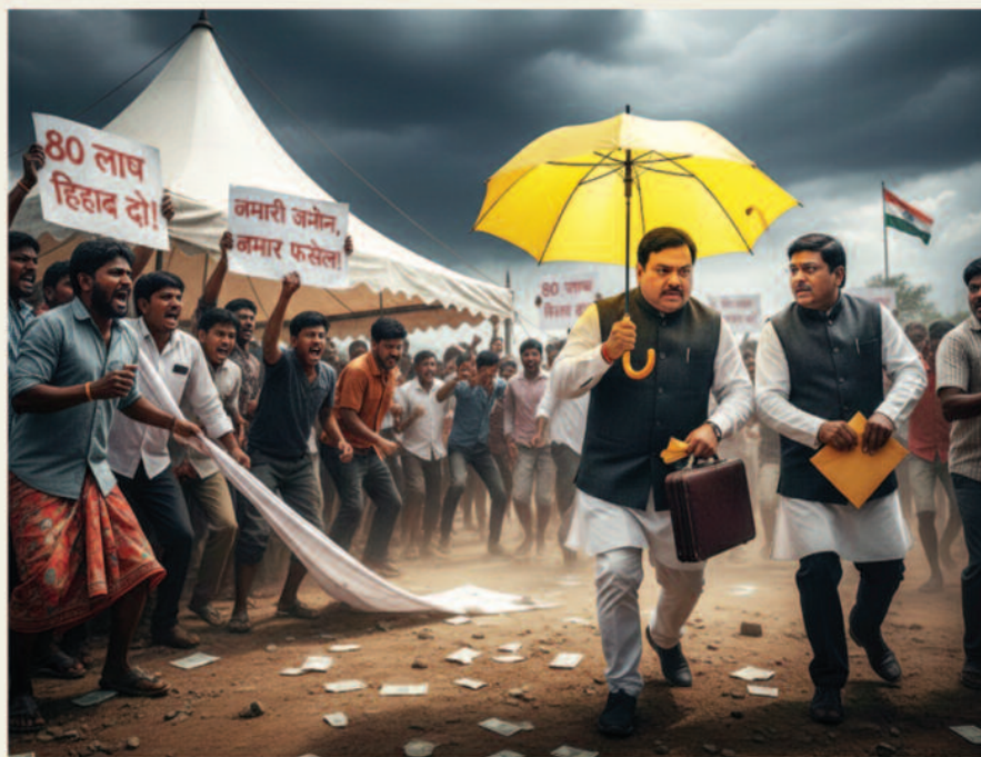
ऑडियो वीडियो के सबूत...