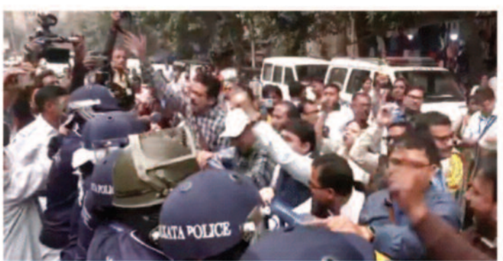
सोमवार को कोलकाता में पश्चिम बंगाल के मुख्य चुनाव अधिकारी के ऑफिस के बाहर बीएलओ अधिकार रक्षा कमेटी के सदस्यों ने प्रदर्शन किया। प्रदर्शनकारियों ने पुलिस से भी बैरिकेड तोड़ने की कोशिश की। ठीक उसी समय बीजेपी नेता सुवेदु अधिकारी और पार्टी के कई एम्प्लॉय चुनाव अधिकारियों के साथ तय मीटिंग के लिए वहाँ पहुंचे थे। वहाँ मौजूद बीजेपी कार्यकर्ताओं से भी प्रदर्शनकारियों की बहस हुई।

नई दिल्ली, 01 दिसम्बर 2025। देश के 12 राज्यों और केंद्र शासित प्रदेशों में 28 अक्टूबर से स्पेशल इंटेन्सिव रिविजन (एसआईआर) की प्रक्रिया जारी है। इसके लिए बृहत् लेवल अधिकारी (बीएलओ) नियुक्त किए गए हैं। हालांकि कई राज्यों में बीएलओ के सुसाइड और मौत की खबरें भी आ रही हैं। उत्तर प्रदेश के संभल में सोमवार को सहायक बीएलओ की सोते-सोते मौत हो गई। इससे पहले 30 नवंबर को मुरादाबाद में एसआईआर काम में लगे टीचर ने सुसाइड कर लिया था। राज्य में अब तक 8 कर्मचारियों की जान जा चुकी है। 3 ने सुसाइड, 3 की हार्ट अटैक से और एक को ब्रेन हेमरेज से मौत हुई थी। सात राज्यों में अब तक 29 बीएलओ की मौत हो चुकी है। सबसे ज्यादा मध्य प्रदेश में 9 बीएलओ की जान गई है। वहीं एसआईआर के विरोध में