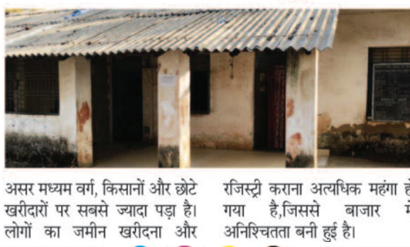
असर मध्यम वर्ग, किसानों और छोटे खरीदारों पर सबसे ज्यादा पड़ा है। लोगों का जमीन खरीदना और रजिस्ट्री कराना अत्यधिक महंगा हो गया है, जिससे बाजार में अनिश्चितता बनी हुई है।

को फिलहाल टाल रहे हैं। अभी तक कोई विरोध नहीं हुआ प्रतापपुर क्षेत्र में अभी तक नई गाइडलाइन के खिलाफ कोई औपचारिक विरोध-प्रदर्शन नहीं हुआ है। लेकिन महंगी रजिस्ट्री के कारण जनता स्वयं ही कार्यालय नहीं पहुंच रही, जिससे रजिस्ट्री कार्य ठप जैसी स्थिति बन गई है। गाइडलाइन से बड़ी पेशानी : अचानक की गई बढ़ोतरी का