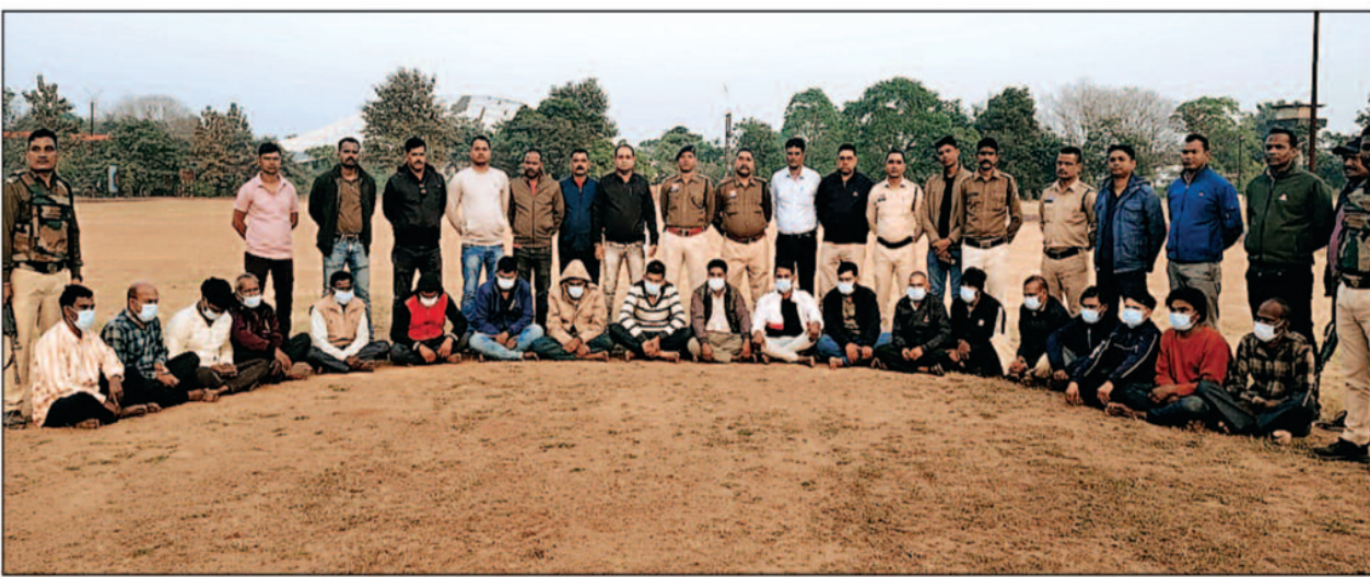
सभी पहलुओं की बारीकी से तकनीकी विश्लेषण, आरोपियों की पहचान कर थाना बालको अपराध 310(4), 61 भारतीय न्याय संहिता (बीएनएस) क्रमांक- 707/2025 धारा- 310(2), एवं 25, 27 आर्म्स एक्ट के तहत 19 आरोपियों