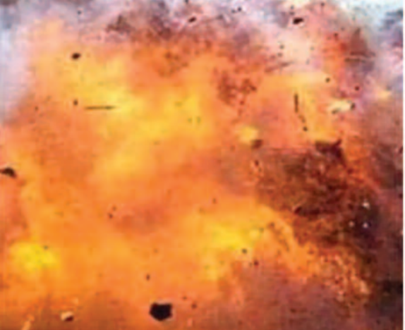
नारायणपुर में कैम्प स्थापित, नक्सली स्मारक ध्वस्त...

रायपुर, 14 नवम्बर 2025। छत्तीसगढ़ में सुरक्षाबलों का नक्सल विरोधी अभियान लगातार जारी है। इस बीच, बीजापुर जिले में नक्सलियों के साथ हुई मुठभेड़ के दौरान आईईडी ब्लास्ट की चपेट में आने से एसटीएफ का एक जवान घायल हो गया, जिसे इलाज के लिए रायपुर रेफर किया गया है। वहीं दूसरी ओर नारायणपुर जिले के अबुलमाड में सुरक्षाबलों ने नया कैम्प स्थापित कर नक्सलियों के भव्य स्मारक को ध्वस्त कर दिया है।