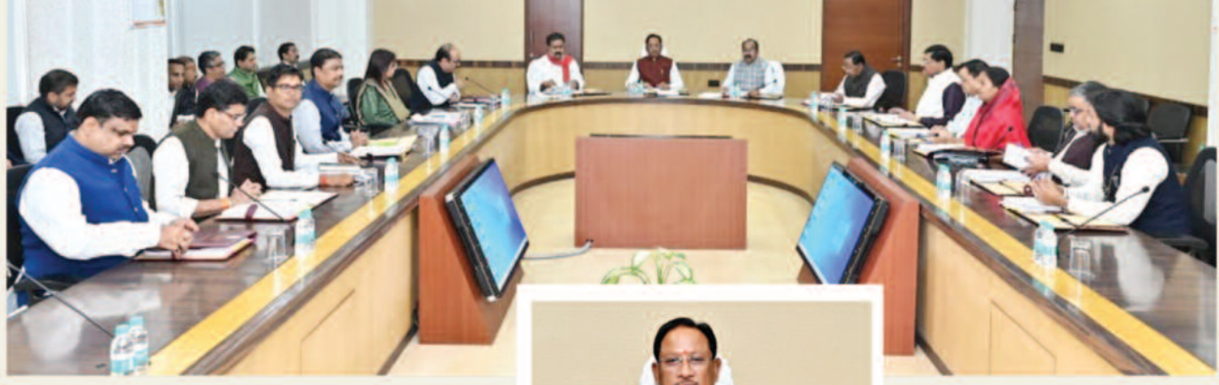
दलहन-तिलहन का समर्थन मूल्य खरीदी जारी रहेगी...

फ्लैटों के विक्रय हेतु 03 बार विज्ञापन होने के पश्चात अतिक्रम भवनों को, पात्र हितग्राही के अतिरिक्त किसी भी आय वर्ग के हितग्राही को विक्रय किया जा सकता है, परन्तु ऐसे हितग्राहियों को शासन द्वारा स्वीकृत अनुदान की पात्रता नहीं होगी। अनुदान को पात्रता केवल निर्धारित आय वर्ग के हितग्राही को ही होगी। ईडब्ल्यूएस एवं एलआईजी भवनों, फ्लैटों के विक्रय हेतु 03 बार विज्ञापन होने के पश्चात अतिक्रम भवनों को एकल व्यक्ति या शासकीय/अर्धशासकीय अथवा निजी संस्थाओं द्वारा एक से अधिक संपत्ति क्रय करने का प्रस्ताव दिया जाता है, तो एकल व्यक्ति या शासकीय/अर्धशासकीय अथवा निजी संस्था के नाम पर एक से अधिक भवनों को मांग अनुसार विक्रय किया जा सकेगा, परन्तु इन्हें शासन द्वारा स्वीकृत अनुदान की पात्रता नहीं होगी। इस निर्णय का व्यापक प्रचार-प्रसार सुनिश्चित किया जाएगा, ताकि अधिक से अधिक हितग्राहियों को इसका लाभ मिले।