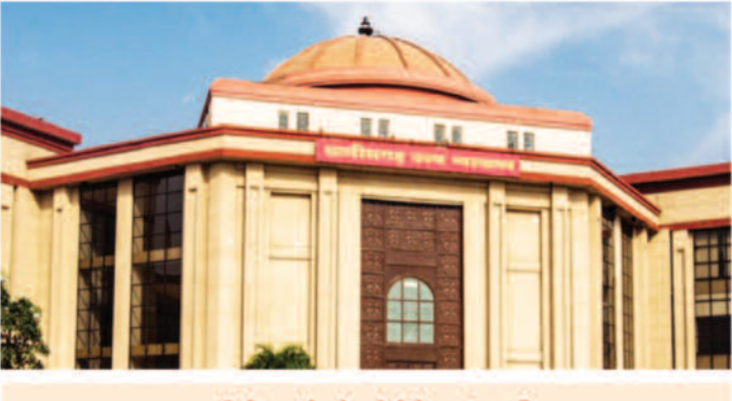
एसएसपी के तर्कों को कोर्ट ने नामंजूर किया...