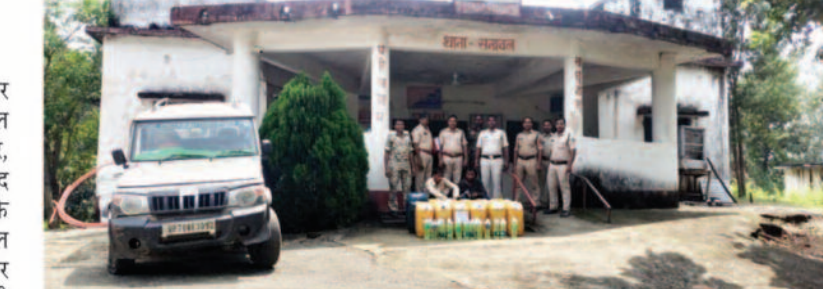
-संवाददाता- सनावल, 23 सितम्बर 2025 (घटती-घटना)

बलरामपुर जिले के सनावल पुलिस ने उत्तर प्रदेश से बोलेरो वाहन से अवैध रूप से डीजल की तस्करी करने वाले दो आरोपी को गिरफ्तार, कर 540 लीटर डीजल भी किया गया बरामद कर भेजा सलाखों के अंदर। जानकारी के अनुसार दिनांक 22.09.2025 को सनावल पुलिस को देहात भ्रमण के दौरान जरिए मुखबिर से सूचना मिला था कि ग्राम सागोबंध बधनी सोनभद्र उत्तर प्रदेश अंतरराज्यीय सीमा से होते त्रिशुली से होकर चार पहिया वाहन बोलेरो क्रमांक यूपी70 बीई3092 में दो व्यक्ति अवैध रूप से प्लास्टिक जरिकेन में भारी मात्रा में डीजल लोड कर तस्करी बिक्री करने हेतु सनावल रामचंद्रपुर की ओर ले जा रहे हैं। सनावल पुलिस के द्वारा प्राप्त सूचना से वरिष्ठ अधिकारियों को अवगत करवाकर गवाहों के साथ त्रिशुली रोड पचावल पुलिस के पास नाकाबंदी कर बोलेरो वाहन क्रमांक यूपी70 बीई3092 को रोक कर चेक किया गया। चेक करते पर पाया गया, बोलेरो वाहन के अन्दर 18 नग जर्कन में ज्वलनशील पदार्थ डीजल लोड होना पाया गया, जिसको लेकर उक्त संबंध में वैध दस्तावेज पेश करने संबंध में नोटिस दिया गया,