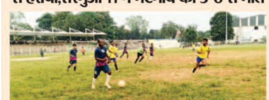
-संवाददाता- अम्बिकापुर, 23 सितम्बर 2025 (घटती-घटना)