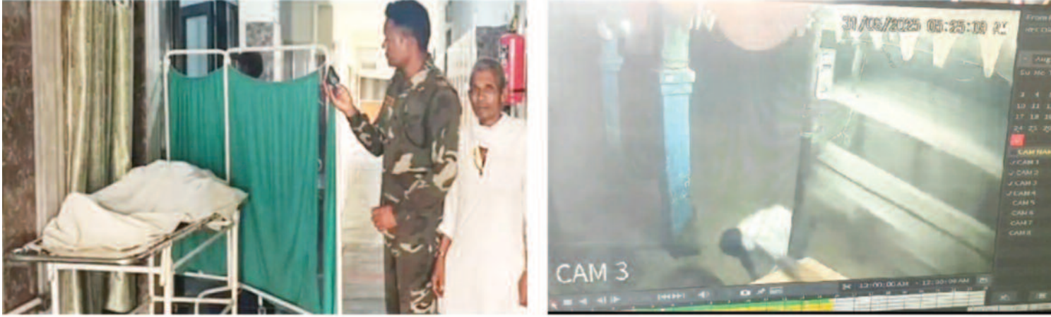
-संवाददाता- अम्बिकापुर/सूरजपुर, 23 सितम्बर 2025 (घटती-घटना)