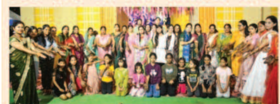
-संवाददाता- अम्बिकापुर, 23 सितम्बर 2025 (घटती-घटना)