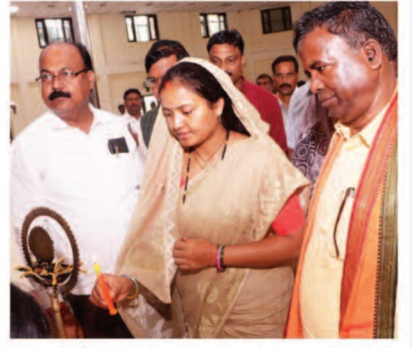
सूरजपुर, 23 सितम्बर 2025 (घटती-घटना)