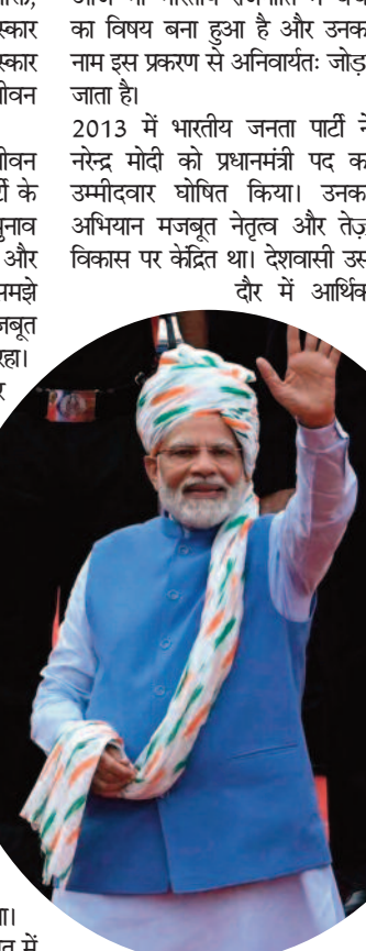
उहराव और भ्रष्टाचार से जस्त थे। मोदी ने जनता में यह विश्वास जगाया कि वे व्यवस्था बदल सकते हैं। 2014 के आम चुनाव में भारतीय जनता पार्टी को ऐतिहासिक बहुमत मिला और नरेन्द्र मोदी प्रधानमंत्री बने। भारत ने तीन दशकों बाद पहली बार पूर्ण बहुमत की सरकार देखी। प्रधानमंत्री बनने के बाद मोदी ने स्वयं को केवल प्रशासक भर नहीं, बल्कि जनसंपर्क में दख नेता के

परिचय मिला। वहाँ से राष्ट्रभक्ति, संगठन और अनुशासन के संस्कार उनके भीतर गहरे छेदे। यही संस्कार आगे चलकर उनके राजनीतिक जीवन की नींव बने। नरेन्द्र मोदी ने अपने राजनीतिक जीवन की शुरुआत भारतीय जनता पार्टी के संगठन कार्य से की। वे चुनाव अभियान में लगे, पार्टी के विस्तार और संगठन खड़ा करने में निपुण समझे जाते थे। गुजरात में पार्टी को मजबूत बनाने में उनका बड़ा योगदान रहा। 1990 के दशक में वे राष्ट्रीय स्तर पर भी पहचान बनाने लगे और संगठन में विभिन्न दायित्व निभाते रहे। 2001 में गुजरात के तत्कालीन मुख्यमंत्री केशूभाई पटेल के अस्वस्थ रहने पर पार्टी ने नरेन्द्र मोदी को राज्य की कमान सौंपी। यही से उनकी राजनीतिक यात्रा ने असली मोड़ लिया। मुख्यमंत्री बनने के बाद मोदी ने गुजरात में प्रशासन को सुदृढ़ करने, उद्योग को प्रोत्साहन देने तथा आधारभूत ढाँचे पर बल देने का काम किया। उनके समर्थक मानते हैं कि गुजरात में उनका शासनकाल विकास उमूख रहा और राज्य में निवेश के लिए अनुकूल वातावरण बना। किन्तु 2002 में गुजरात में भयानक दंगे हुए, जिनमें सैकड़ों लोग मारे गए। यह घटना नरेन्द्र मोदी से जीवनपर्यंत जुड़ा एक गम्भीर विवाद बन गई। आलोचक मानते रहे कि दंगों को रोकने में प्रशासन विफल रहा, जबकि उनके समर्थक तर्क देते हैं कि मोदी ने शांति बहाल करने के लिए तत्पराता से कदम उठाए। यह विवाद