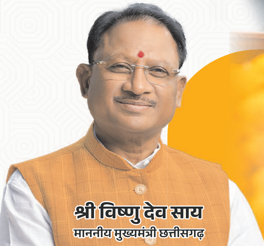
श्री विष्णु देव साय माननीय मुख्यमंत्री छत्तीसगढ़