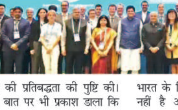
प्रति भारत की प्रतिबद्धता की पुष्टि की।

नई दिल्ली के भारत मंडप में भारतीय मानक ब्यूरो (बीआईएस) द्वारा आयोजित अंतरराष्ट्रीय इलेक्ट्रोटेक्निकल आयोग (आईईसी) की 89वाँ आम बैठक एवं प्रदर्शनी के उद्घाटन समारोह को संबोधित करते हुए यह बात कही। गोयल ने एक सतत विश्व को बढ़ावा देना विषय पर बोलते हुए स्थिरता, सुरक्षा और दक्षता के