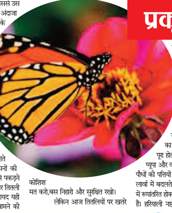
कोशिश मत करो, बस निहारो और सुश्रुत रखो। लेकिन आज तितलियों पर खतरे