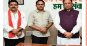
दौरान ननों की गिरफ्तारी और धर्मांतरण के आरोपों पर विस्तृत चर्चा हुई।