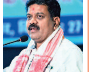
की बेटियों को ले जाया जा रहा था। ऐसी और घटनाएं पिछले कुछ वर्षों में हुई हैं, जिनकी जानकारी मिलती है इसलिए यह मामला जांच का विषय है। कानून अपना काम कर रहा है। सभी अभी जेल में हैं। डिप्टी सीएम ने कहा, छत्तीसगढ़ में धर्मांतरण को लेकर नया कानून ला रहे हैं। इसके बाद धर्मांतरण के मामलों पर और भी स्पष्टता हो जाएगी। छत्तीसगढ़ के लिए एक कानून बहुत प्रभावी रहेगा।

छत्तीसगढ़ में 2 नन की गिरफ्तारी पर सियासत गरमा गई है। जेल में बंद ननों से मुलाकात करने केरल से इंडिया गठबंधन का डेलिगेशन छत्तीसगढ़ पहुंचा है। इस मामले पर उप मुख्यमंत्री विजय शर्मा ने कहा, पूरे मामले पर विस्तृत जांच की जा रही है। जीआरपी थाने में एफआईआर हुआ है। उनके बयानों के आधार पर एफआईआर के पयास आधार उनके पास है। कानून अपना काम कर रहा है। डिप्टी सीएम ने कहा, जीआरपी थाने में एफआईआर कर बयान भी दर्ज कराया गया है। इन बयानों के आधार पर एफआईआर करने के पयास आधार की स्पष्टता है। केरल के इन ननों द्वारा हमारे अबुलमाइद