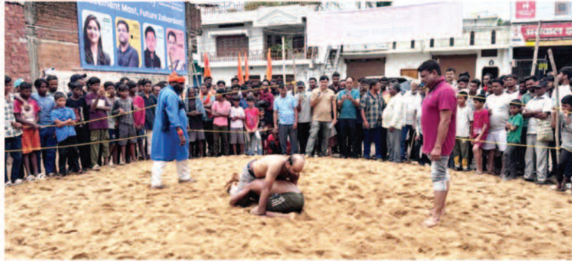
-संवाददाता- अंबिकापुर, 29 जुलाई 2025 (घटती-घटना)।

आज नागपंचमी के शुभ अवसर पर अंबिकापुर शहर की अनोखी सोच सामाजिक संस्था ने अपने धार्मिक और सांस्कृतिक उत्थान के उद्देश्यों के अंतर्गत स्थानीय बाबा विश्वनाथ एवं संकट मोचन हनुमान मंदिर में विधि विधान से पूजा का कार्य सम्पन्न कराया जिसमें आसपास के क्षेत्र के बड़ी संख्या में श्रद्धालुओं ने भक्ति भाव से पूजा अर्चना किया और महादेव और बजरंगबली से आशीर्वाद प्राप्त किया। इसके पश्चात संस्था