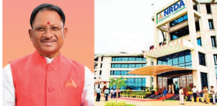
रायपुर, 29 जुलाई 2025 (ए)। एक लंबे समय तक केवल प्राकृतिक

साय सरकार की डिजिटल क्रांति को मिल रही रफ्तार