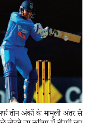
सिर्फ तीन अंकों के मामूली अंतर से पीछे छोड़ते हुए करियर में तीसरी बार

नई दिल्ली, 29 जुलाई 2025। आईसीसी ने ताजा रैंकिंग जारी कर दी है, जिसमें भयंकर उलटफेर देखने को मिला है। आईसीसी की महिला वनडे बैटिंग रैंकिंग में भारत की धाकड़ बल्लेबाज स्मृति मंधाना की बादशाहत खत्म हो गई है। मंधाना को एक पायदान का नुकसान हुआ है और वो अब नंबर-1 से लड़कर दूसरे पायदान पर आ गई हैं। मंधाना की जगह अब वनडे में इंग्लैंड की कप्तान नेट साइबर-ब्रंट नंबर-1 महिला बल्लेबाज बन गई हैं। नेट