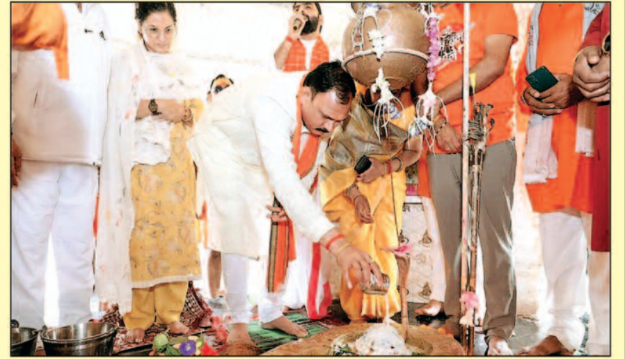
स्वास्थ्य मंत्री धर्म कर्म के आयोजन में हर संभव शामिल होने का प्रयास करते हैं...