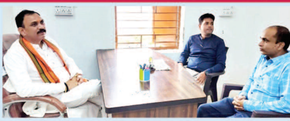
चलता रहा सफेद पन्ने विरोध में काले होते रहे, कलमबंद अभियान को बंद करने प्रदेश के स्वास्थ्य मंत्री ने पहल की सार्थक बातचीत के बीच यह कलम बंद अभियान 11 अगस्त 2024 को 70 दिन बाद बंद हुआ,

इस घटना के बाद सच्ची खबरों के प्रकाशन से प्रभावित हुए लोगों के लिए यह दिन काफी अच्छा दिन था, यह उनके दिल दिमाग को सुकून देने वाला दिन था पर पाठकों के लिए यह दिन काफी खराब था, सरकार के लिए लोगों की सोच बदल गई थी, इस घटना की निंदा भी खूब हुई थी भले ही इस योजना में कुछ लोग सफल थे और उनके लिए सुकून वाली खबर थी पर वही पूरे प्रदेश में इस खबर और इस घटना की आलोचना भी हो रही थी, इसके बाद भी अखबार ने कलम बंद अभियान को बंद नहीं किया और यह अभियान