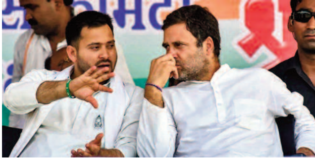
राहुल गांधी का बड़ा दावा

राजद नेता तेजस्वी यादव ने चुनाव बहिष्कार की बात को दोहराते हुए कहा, अगर चुनाव में धांधली ही करनी है, तो फिर बिहार सरकार को वैसे ही एक्सपेंशन दे दीजिए। महगठबंधन के सभी दल चुनाव बहिष्कार के विकल्प पर विचार कर सकते हैं। तेजस्वी ने