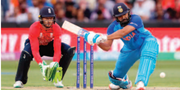
पांच टी20 मैचों की सीरीज होगी, इसके बाद तीन वनडे मुकाबले खेले जाएंगे। इसके शेड्यूल का भी ऐलान कर दिया गया है। एक जुलाई से खेली जाएगी पांच टी20 मैचों की सीरीज भारतीय क्रिकेट टीम करीब करीब पूरी जुलाई इंग्लैंड में ही रहेगी। भारत और इंग्लैंड के बीच पहला टी20 मुकाबला एक जुलाई 2026 को खेला जाएगा। इसके बाद चार, सात और नौ जुलाई को आगे के मुकाबले खेले जाएंगे। टी20 इंटरनेशनल मैचों की सीरीज का अगला मुकाबला 11 जुलाई को होगा। दो दिन रेस्ट के बाद वनडे

नई दिल्ली, 24 जुलाई 2025। भारतीय क्रिकेट टीम इस वक्त इंग्लैंड के दौर पर है। जहां पांच टेस्ट मैचों की सीरीज खेली जा रही है। तीन मैच हो चुके हैं और चौथा मुकाबला इस वक्त मैनचेस्टर में जारी है। इस सीरीज में केवल टेस्ट मुकाबले ही होने हैं, जो वर्ल्ड टेस्ट चैंपियनशिप के तहत होंगे। इस बीच अब दोनों देशों के बीच वनडे और टी20 इंटरनेशनल मैचों की सीरीज का भी ऐलान कर दिया गया है। हालांकि ये अभी नहीं हैं। अगले साल के लिए जारी किया गया शेड्यूल इंग्लैंड एंड वेल्स क्रिकेट बोर्ड यानी ईसीबी की ओर से अगले साल यानी 2026 गर्मी में होने वाले मैचों के शेड्यूल का ऐलान कर दिया है। इंग्लैंड की टीम न्यूजीलैंड, पाकिस्तान और श्रीलंका के अलावा भारतीय टीम से भी भिड़ती हुई नजर आएगी। भारत और इंग्लैंड के बीच पांच टी20 मैचों की सीरीज होगी, इसके बाद तीन वनडे मुकाबले खेले जाएंगे। इसके शेड्यूल का भी ऐलान कर दिया गया है। एक जुलाई से खेली जाएगी पांच टी20 मैचों की सीरीज भारतीय क्रिकेट टीम करीब करीब पूरी जुलाई इंग्लैंड में ही रहेगी। भारत और इंग्लैंड के बीच पहला टी20 मुकाबला एक जुलाई 2026 को खेला जाएगा। इसके बाद चार, सात और नौ जुलाई को आगे के मुकाबले खेले जाएंगे। टी20 इंटरनेशनल मैचों की सीरीज का अगला मुकाबला 11 जुलाई को होगा। दो दिन रेस्ट के बाद वनडे