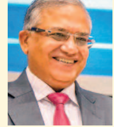
मुख्य चुनाव आयुक्त ज्ञानेश कुमार

बिहार में चल रहे विशेष गहन संशोधन अभियान को लेकर विपक्ष के लगातार विरोध के बीच मुख्य चुनाव आयुक्त ज्ञानेश कुमार ने इस प्रक्रिया का पुरजोर बचाव किया है। उन्होंने सवाल उठाया कि क्या चुनाव आयोग को मरे हुए मतदाताओं, डुलिकेट मतदाता पहचान पत्र धारकों और विदेशी नागरिकों को वोटर लिस्ट में शामिल करने की अनुमति देनी चाहिए। यह बयान तब आया है जब राष्ट्रीय जनता दल, कांग्रेस और अन्य विपक्षी दलों ने एसआईआर अभियान के खिलाफ तीखा विरोध जताया है। विपक्षी दलों का दावा है कि एसआईआर की प्रक्रिया से 50 लाख से अधिक मतदाताओं के मताधिकार छिन सकते हैं। बता दें कि गुरुवार को भी, कांग्रेस संसदीय दल की अध्यक्ष सोनिया गांधी समेत इंडिया गठबंधन के कई सांसदों ने बिहार में चुनाव आयोग द्वारा मतदाता सूची में संशोधन के खिलाफ संसद भवन परिसर में विरोध प्रदर्शन किया।