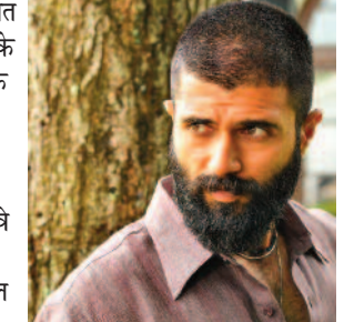
विजय देवरकोंडा अपनी बहुप्रतीक्षित एक्शन से भरपूर फिल्म किंगडम के साथ दर्शकों का मनोरंजन करने के लिए पूरी तरह तैयार हैं। अभिनेता को कथित तौर पर डेगू के कारण अस्पताल में भर्ती कराया गया था। हाल ही में उन्हें छुट्टी मिली है और वे ठीक हो रहे हैं। ऐसा लग रहा है कि वह काम पर वापस आ गए हैं। हाल ही में, विजय ने ट्रेलर रिलीज की घोषणा के साथ किंगडम से एक नया दिलचस्प पोस्टर जारी किया। यह 31 जुलाई को फिल्म की नाटकीय रिलीज से पहले आया है। टीजर के अनावरण ने पहले ही प्रशंसकों को उत्साहित कर दिया है और इस खबर ने फिल्म के लिए और भी अधिक प्रत्याशा पैदा कर दी है। इंस्टाग्राम स्टोरी पर ले जाते हुए, विजय देवरकोंडा ने एक पोस्टर के माध्यम से प्रशंसकों को अपने चरित्र की एक नई झलक दिखाई। इसके साथ ही, उन्होंने ट्रेलर की तारीख का खुलासा किया, जिसका प्रशंसक बेसब्री से इंतजार कर रहे थे। छवि में, विजय को जेल में हाथों में हथकड़ी के साथ देखा जा सकता है। इससे पहले, टीजर ने विजय को एक पुलिस वाले की भूमिका में पेश किया ट्रेलर 26 जुलाई को रिलीज होगा। विजय के अलावा, फिल्म में भाग्यश्री बोसे और सत्यदेव भी हैं।