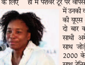
बनाने का लक्ष्य बना रही हैं, जिसमें बड़े बदलाव के बाद अब 7,50,000 का पुरस्कार प्लू है।

ने अब पुष्टि की है कि डब्ल्यूटीए की दिग्गज वीनस विलियम्स भी इस लाइनअप में शामिल होंगी, जो हाल ही में पेशेवर टूर पर वापसी के बाद ग्रैंड स्लैम टेनिस में उनकी वापसी का प्रतीक है। दो बार की यूएस ओपन एकरल चैंपियन और दो बार की युगल खिताब विजेता, साथी अमेरिकी रीली ओपेल्का के साथ जोड़ी बनाएंगी। 1990 और 2000 के दशक में बहन सेरेना के साथ टेनिस में एक प्रमुख शक्ति रही वीनस, मिश्रित युगल ड्रॉ में जगह