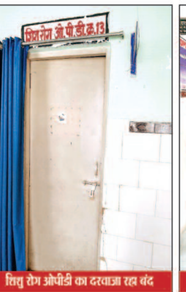
तिरु रोग ओपीडी का दरवाजा रत बंद

में आया मरीज फिर इंतजार के लिए या तो डॉक्टर के मजबूर हो जाता है और कुछ समय तक और शारीरिक कष्ट झेलता है और या फिर निजी किसी अस्पताल या डॉक्टर के पास जाने निर्णय लेने विवश हो जाता है। जिला चिकित्सालय का यह हाल एक दिन का नहीं है यह प्रतिदिन का मामला हो गया है और अब बरसात के इस मौसम में जब बीमारियां बढ़ी हुई हैं मरीज भी इस कारण दिक्रत परेशानी झेलने मजबूर हैं। जिला चिकित्सालय के डॉक्टरों के विलंब से अस्पताल आने के पीछे की वजह उनका निजी प्रैक्टिस बताया