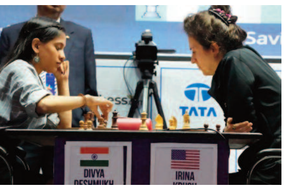
नए वर्ल्ड चैंपियनशिप चक्र का हिस्सा है। इसका मतलब यह भी है कि अगले साल होने वाले महिला कैडिडेट्स टूर्नामेंट में एक भारतीय का प्रवेश पक्का हो गया है।