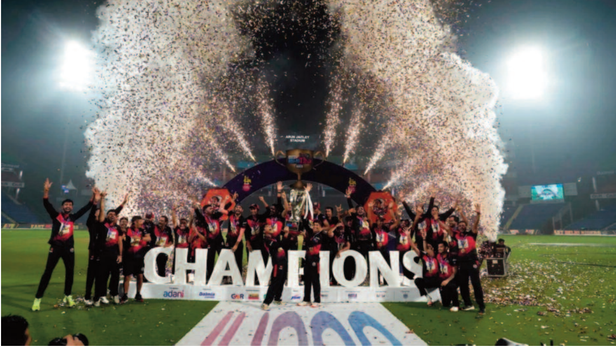
स्ट्राइकर्स जबकि ग्रुप बी में वेस्ट दिल्ली लॉयर्स, ईस्ट दिल्ली राइडर्स, साउथ दिल्ली सुपरस्टार्ज और पुरानी दिल्ली 6 शामिल हैं।

इस बार की प्रतियोगिता में मेन्स कैटेगरी को दो ग्रुप में बांटा गया है और हर ग्रुप में चार-चार टीमों शामिल की गई हैं। ग्रुप ए में आउटर दिल्ली वॉरियर्स, सेंट्रल दिल्ली किंग्स, न्यू दिल्ली टाइगर्स और नॉर्थ दिल्ली