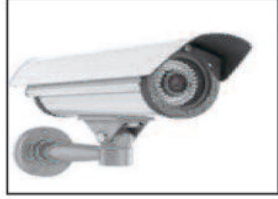
डॉक्टर व स्टाफ की लापरवाही सीसीटीवी में देखी जा सकती है...

आपको बता दें कि मंगलवार के दिन यानी की 22 जुलाई जिला अस्पताल में मरीजों की भीड़ थी और मेडिसिन काउंटर से लेकर ओपीडी में कोई भी स्टाफ व डॉक्टर नहीं थे, मरीज डॉक्टर डॉक्टर का इंतजार करते देखे जा रहे थे जब वहां पर पता किया गया तो पता चला कि ऐसी स्थिति आए दिन देखने को मिलती है और यदि विश्वास नहीं है तो अस्पताल में लगे सीसीटीवी कैमरे को खंगाल गया तो डॉक्टर के आने के समय और स्टाफ के आने को समय को उसमें साफ देखा जा सकता है, पर अब इतनी जहमत उठोगा कौन क्योंकि किसी में नहीं स्वस्थ व्यवस्था बेहतर करने की लालसा है ही नहीं?