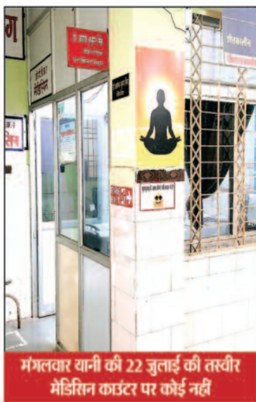
मंगलवार यानी की 22 जुलाई की तस्वीर मेडिसिन काउंटर पर कोई नहीं

आपको बता दें कि मंगलवार के दिन यानी की 22 जुलाई जिला अस्पताल में मरीजों की भीड़ थी और मेडिसिन काउंटर से लेकर ओपीडी में कोई भी स्टाफ व डॉक्टर नहीं थे, मरीज डॉक्टर डॉक्टर का इंतजार करते देखे जा रहे थे जब वहां पर पता किया गया तो पता चला कि ऐसी स्थिति आए दिन देखने को मिलती है और यदि विश्वास नहीं है तो अस्पताल में लगे सीसीटीवी कैमरे को खंगाल गया तो डॉक्टर के आने के समय और स्टाफ के आने को समय को उसमें साफ देखा जा सकता है, पर अब इतनी जहमत उठोगा कौन क्योंकि किसी में नहीं स्वस्थ व्यवस्था बेहतर करने की लालसा है ही नहीं?