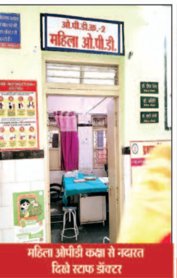
महिला ओपीडी कक्षा से नदारत दिखे स्टाफ डॉक्टर

कोरिया, 22 जुलाई 2025 (घटती-घटना)। कोरिया जिले का जिला चिकित्सालय अब मरीजों के लिए ऐसा सुविधा केंद्र हो चुका है जहां मरीज बीमारी में आते तो हैं समय पर इलाज की चाहत में जल्द आराम की उम्मीद में लेकिन उन्हें जब आकर यह पता चलता है कि डॉक्टर तो बैठे ही नहीं हैं जबकि उनके अपने कक्ष में बैठने का समय हो गया है और वह फिर भी कक्ष से अस्पताल आने के इलाज और अपने कक्ष से आराम की चाहत