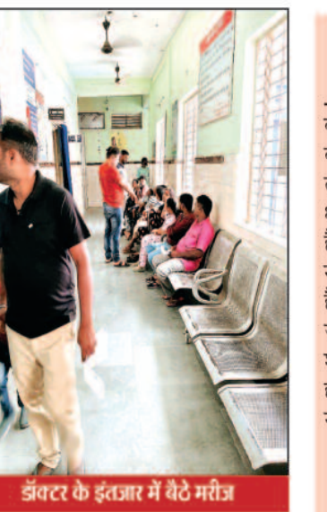
डॉक्टर के इंतजार में बैठे मरीज

जाता है और जिसको वह ज्यादा प्राथमिकता देते हैं। कई ऐसे डॉक्टर भी हैं जो विलंब से आते हैं जिन्हें लोग भगवान भी मानते हैं लेकिन वह अपना मूल कर्तव्य नहीं निभाना चाहते मन से वह निजी प्रैक्टिस को ज्यादा तवज्जो देते हैं क्योंकि यह उन्हें अतिरिक्त आय नहीं है यह प्रतिदिन का मामला हो गया है और अब बरसात के इस मौसम में जब बीमारियां बढ़ी हुई हैं मरीज भी इस कारण दिक्रत परेशानी झेलने मजबूर हैं। जिला चिकित्सालय के डॉक्टरों के विलंब से अस्पताल आने के पीछे की वजह उनका निजी प्रैक्टिस बताया