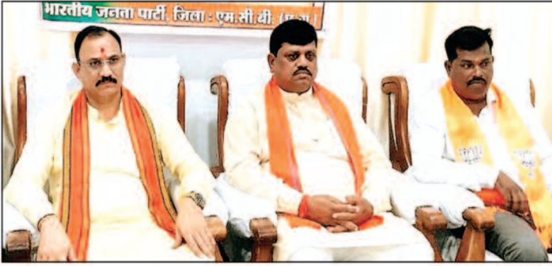
भारतीय जनता पार्टी, जिला-एमसीबी (एमसीबी)।

श्री श्याम बिहारी जायसवाल ने कहा कि जब छत्तीसगढ़ में कांग्रेस की सरकार रही तब