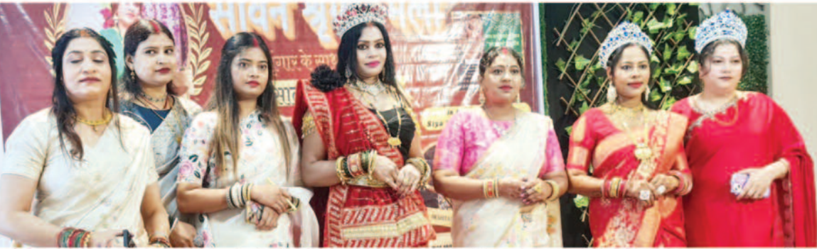
अम्बिकापुर, 20 जुलाई 2025 (घटती-घटना)।

नगर के अलंकार ग्रीन होटल में पथ इवेंट की ओर से सावन की महोत्सव में सावन श्रृंगार मेला का बृहद आयोजन किया गया। लगातार चौथे साल इस भव्य आयोजन में सभी ने उत्साह के साथ हिस्सा लिया। यह आयोजन सिर्फ महिलाओं और लड़कियों के लिए था, जिसकी थीम ग्रीन एवं सोलह सिंगार थी। जिन महिलाओं में टैलेंट है और उन्हें मौका नहीं मिलता, ऐसी श्रेयल महिलाओं को पार्थ इवेंट में एक मंच दिया। इस आयोजन में समीक्षक के रूप में नेशनल एवं इंटरनेशनल लेवल के ग्राउंड होल्डर मौजूद थे।