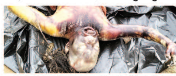
लखनपुर, 20 जुलाई 2025 (घटती-घटना)।