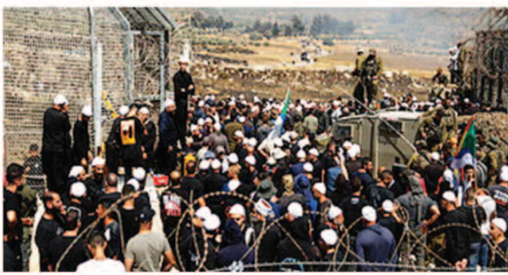
लोग विस्थापित हुए।

माजरा, 20 जुलाई 2025। सीरिया के दक्षिणी शहर स्वैदा में करीब एक हफ्ते तक चले झड़प के बाद बेदुइन समुदाय के सशस्त्र लड़ाकों ने रविवार को शहर से हटने की घोषणा की है। यह कदम अमेरिका की मध्यस्थता में हुए संघर्षविरोध के बाद उठाया गया है। इस बीच, मानवीय सहायता लेकर 32 ट्रकों का काफिला शहर में दाखिल हुआ है, क्योंकि झड़पों के चलते शहर में बिजली, पानी, दवाइयों और ईंधन की भारी कमी हो गई थी।