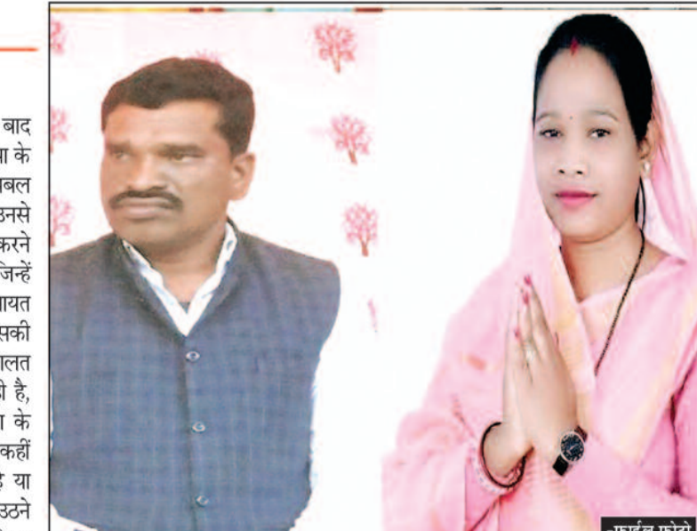
जिसे लेकर भाजपा जिलाध्यक्ष की खूब किरकिरी भी हुई थी आज संगठन भी इस फैसले को लेकर अब अंदर खाने से खुश नहीं है कहीं ना कहीं इस फैसले को अब कांग्रेसी रहे कोरिया जिला पंचायत के अध्यक्ष