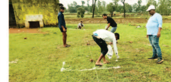
अम्बिकापुर, 18 जुलाई 2025 (घटती-घटना)।

विगत दिनों कलेक्टर ने निरीक्षण कर स्कूल भवन निर्माण करने के लिए निर्देश