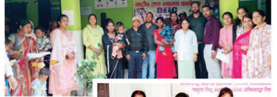
अम्बिकापुर, 18 जुलाई 2025 (घटती-घटना)।