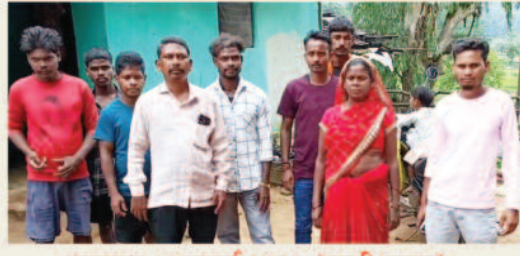
लखनपुर, 18 जुलाई 2025 (घटती-घटना)।

छत्तीसगढ़ का सरगुजा संभाग आदिवासी बहुल क्षेत्र है जहां बड़ी संख्या में आदिवासी समुदाय के लोग निवास करते हैं। आदिवासी जनजाति के लोग तीज त्योहारों खेती-बाड़ी के समय हर मौके पर शराब सेवन करते हैं। यही नहीं सरकार के द्वारा इन्हें शराब बनाने के लिए भी छूट दी गई है। आबकारी विभाग के टीम के द्वारा इन आदिवासी जनजाति के घरों में जबरन घुसकर अवैध महुआ शराब में कार्रवाई की धमकी देकर अवैध वसूली किया जाता है। कुछ ऐसा है मामला सरगुजा जिले के आदिवासी बहुल ग्राम में देवने को मिला। दरअसल पूरा मामला सरगुजा जिले के लुण्डा विधानसभा क्षेत्र के लखनपुर विकासखंड के पहुंचे ग्राम सेलरा देव भुडू लब्बी का है। 17 जुलाई दिन गुरुवार की दोपहर आबकारी विभाग की टीम इन गांवों में अवैध महुआ शराब के खिलाफ कार्रवाई करने पहुंची हुई थी। ग्रामीणों का आरोप है कि कृषि कार्य में सभी ग्रामीण खेत में कार्य कर रहे थे वहीं आबकारी विभाग की टीम जबरन घर में घुसकर अवैध महुआ शराब जांच कर रही थी यही नहीं ग्रामीणों ने आरोप लगाया कि आबकारी विभाग के कर्मचारियों के द्वारा अवैध वसूली भी किया गया है। जो आज लखनपुर क्षेत्र में जन चर्चा का विषय बना हुआ है वहीं ग्रामीणों की सूचना पर जब स्थानीय मीडिया की टीम मौके पर पहुंची तो आबकारी विभाग के अधिकारी कर्मचारी भागने लगे और मीडिया कर्मियों ने वाहन रोक रुकवा कर अवैध महुआ शराब के खिलाफ कार्रवाई को लेकर पृच्छाछ किया तो उन्हें गोलमोल जवाब दिया और किसी भी प्रकार की जानकारी देने से साफ इनकार कर दिया गया।