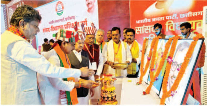
अम्बिकापुर, 07 जुलाई 2025 (घटती-घटना)।