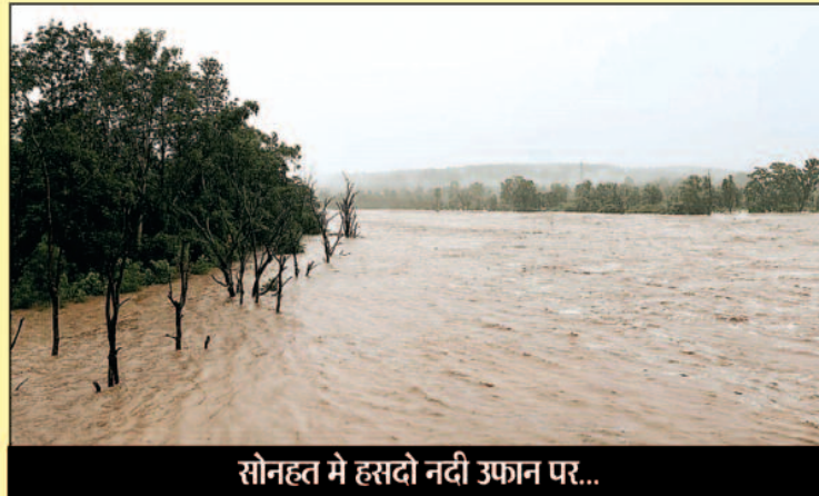
सोनहत में हसदो नदी उफान पर...