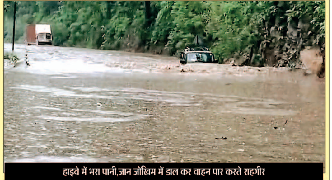
हाइवे में भरा पानी, जान जोखिम में डाल कर वाहन पार करते राहगीर