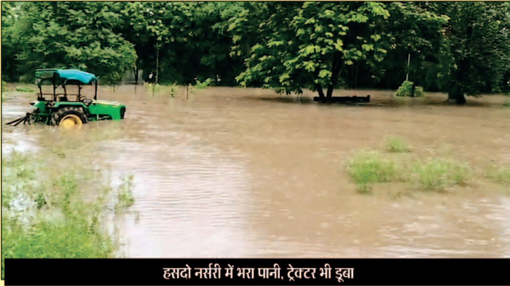
हसदो नर्सरी में भरा पानी, ट्रैक्टर भी डूबा