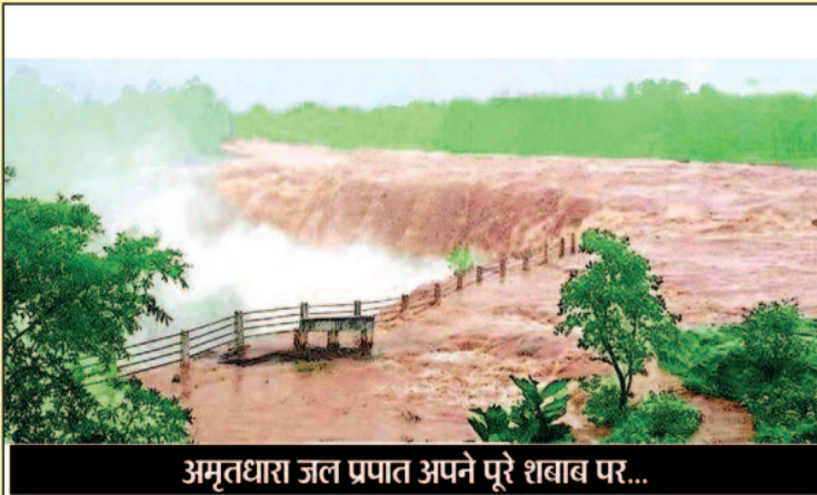
अमृतधारा जल प्रपात अपने पूरे शबाब पर...

» कई जगज गिरे पेड़ कुछ घर भी हुए धरासाई, कहीं पर गिरी दीवारें