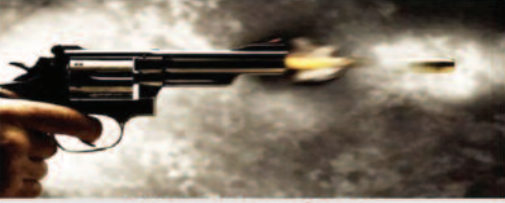
वॉशिंगटन, 07 जुलाई 2025।