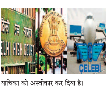
याचिका को अस्वीकार कर दिया है।