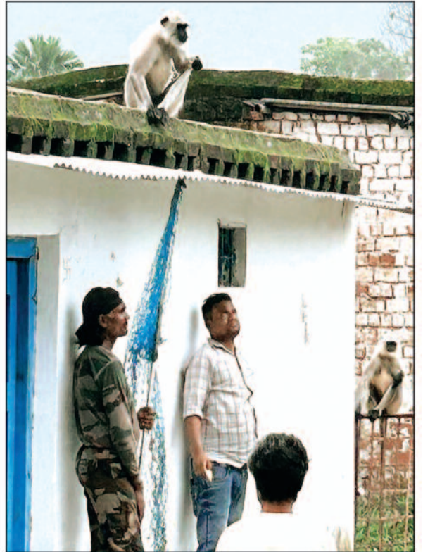
बंदर को पकड़ने में 3 घंटे की हुई मशक्कत

बंदर को पकड़ने में 3 घंटे की मशक्कत लगने की बात सामने आई है,बंदर बड़ी मुश्किल से 3 घंटे के प्रयासों उपरत वन विभाग के पिंजड़े में कैद हो सका है,बताया जा रहा है पहले चिन्हांकित किया गया की बंदर जिसे पकड़ना है वह कौन सा है और उसके बाद वन विभाग के द्वारा प्रयास जारी किया गया,इधर उधर भागते छिपते बंदर पकड़ में आया और पिंजड़े में कैद हुआ।