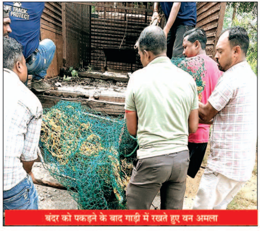
बंदर को पकड़ने के बाद गाड़ी में रखते हुए वन अमला

बताया जा रहा है कि वह बंदर जिसे रेस्क्यू ऑपरेशन चलाकर वन विभाग ने पकड़वा पागल हो गया था और वह लगातार कालोनी वासियों को घायल कर रहा था उनके ऊपर हमला कर रहा था। हमला करने वाला बंदर वन विभाग द्वारा पकड़कर रामगढ़ के जंगलों में छोड़ा जाएगा ऐसा बताया जा रहा है वहीं अब कॉलोनी वासियों ने राहत की सांस ली है और उन्होंने यह उम्मीद जाहिर की है कि वन विभाग लगातार इसी तरह बंदरों के मामले में तत्काल संज्ञान लेगा और उन्हें रहवासी क्षेत्र से दूर करने का कार्य करेगा,बता दें कि कटकोना कॉलोनी क्षेत्र में बंदरों का आतंक मामले पर दिनांक 06 जुलाई को ही खबर दैनिक घटती-घटना ने प्रकाशित की थी और उसके कुछ घंटे बाद ही वन विभाग एक्सन मोड में नजर आया और उसने कम से कम उस बंदर का रेस्क्यू किया जो बताया जा रहा है कि पागल हो चुका था और जो रहवासियों पर लगातार हमला कर रहा था उन्हें बुरी तरह घायल कर रहा था। बंदरों के मामले में कटकोना कॉलोनी कॉलोनी की स्थिति अब ऐसी बताई जा रही है कि