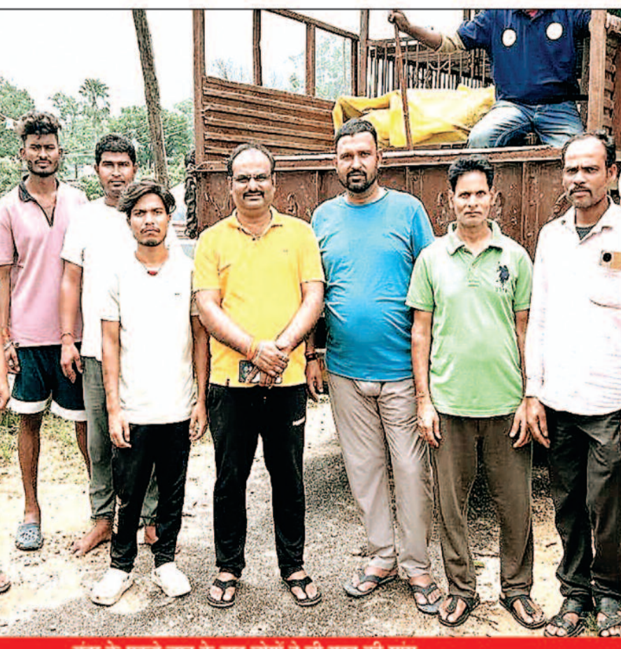
बंदर के पकड़े जान के बाद लोगों ने ली राहत की सांस

जिस बंदर को पकड़ गया है उसे बताया जा रहा है पागल