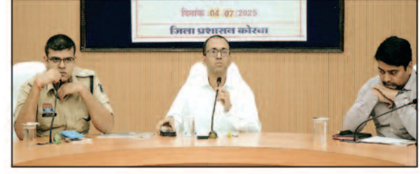
कोरबा,06 जुलाई 2025