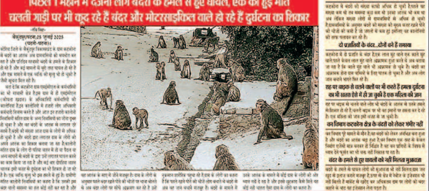
घटती घटना में दर्जनों लोग बंदरों के हमले से हुए घायल, एक की हुई मौत चालती गाड़ी पर भी चढ़ रहे हैं बंदर और मोटरसाइकिल चाले हो रहे हैं दुर्घटना का शिकार

कटकोना क्षेत्र में बंदरों की संख्या इंसानों की संख्या से हुई पार...प्रवासियों की संख्या से दुगुने हो गए हैं बंदरों की संख्या