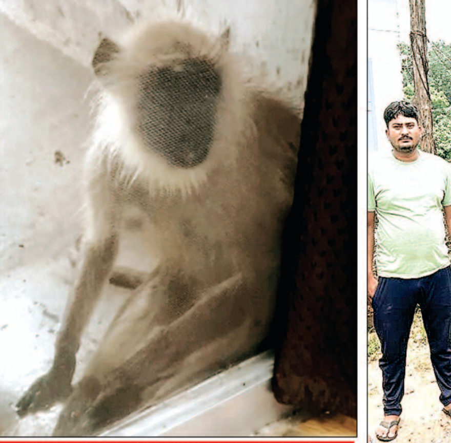
यहां था आदमखोर बंदर जिसने लोगों को कर रखा था परेशान... आखिर वन विभाग की मिली पकड़ने में सफलता

-संवाददाता- बैकुंठपुर/पटना,06 जुलाई 2025 (घटती-घटना)।