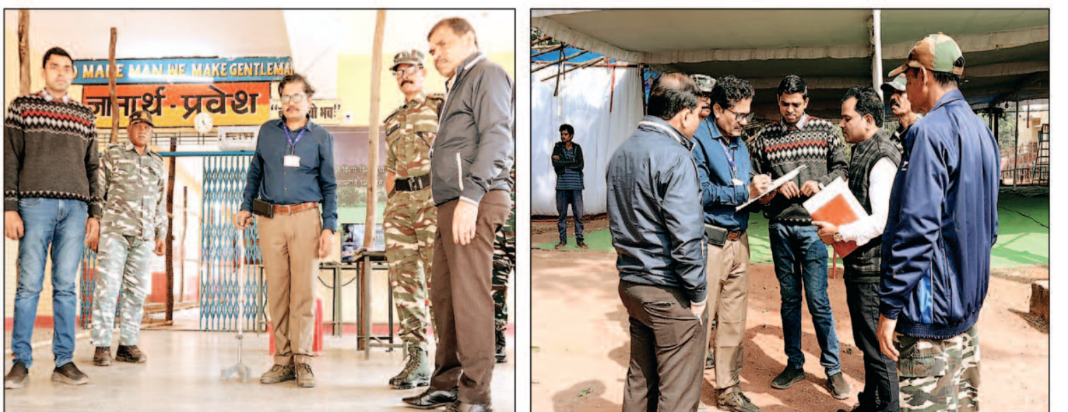
जशपुरनगर, 26 नवम्बर 2023 (घटती-घटना)।