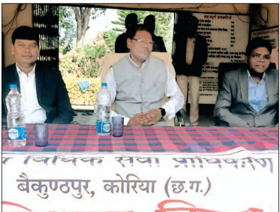
-संवाददाता- बैकुण्ठपुर, 26 नवम्बर 2023 (घटती-घटना)।